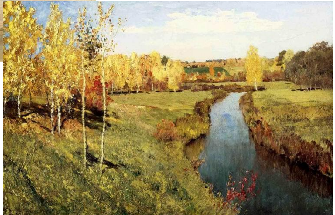
Золотая осень, 1895г.