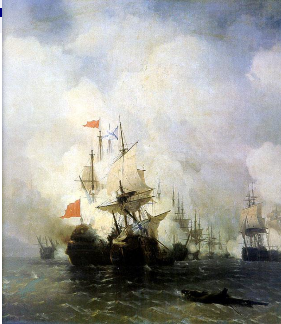
Бой в Хиосском проливе 1848

Живописец Главного морского штаба (с 1844), Айвазовский принимает участие в ряде военных кампаний (в том числе в Крымской войне 1853–1856), создав немало патетических батальных полотен