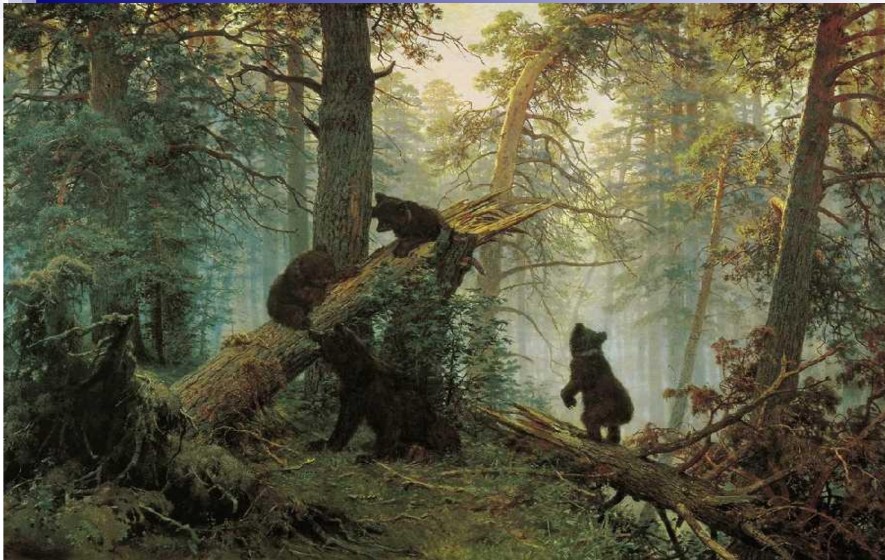
Утро в сосновом бору