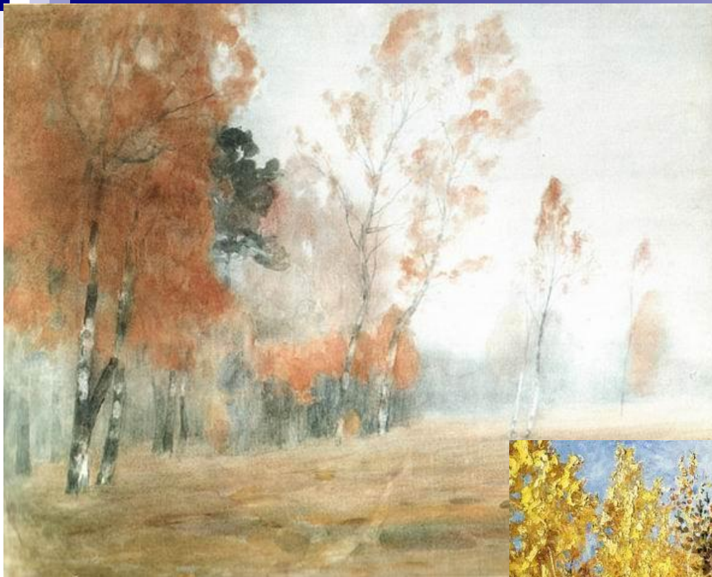
Осень. Туман, 1898г.