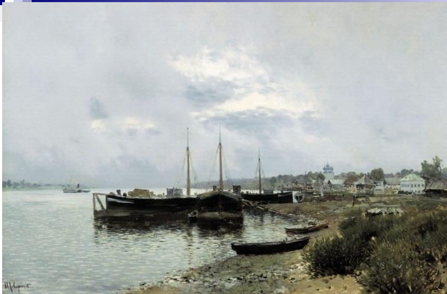
После дождя. 1889 г.

Учителями Левитана были Алексей Саврасов и Василий Поленов. “Левитану давалось все легко, - вспоминал его товарищ, известный русский живописец Михаил Нестеров, - тем не менее, работал он упорно, с большой выдержкой. Левитан работал быстро, скоро усваивая то, на что другие тратили немало усилий.