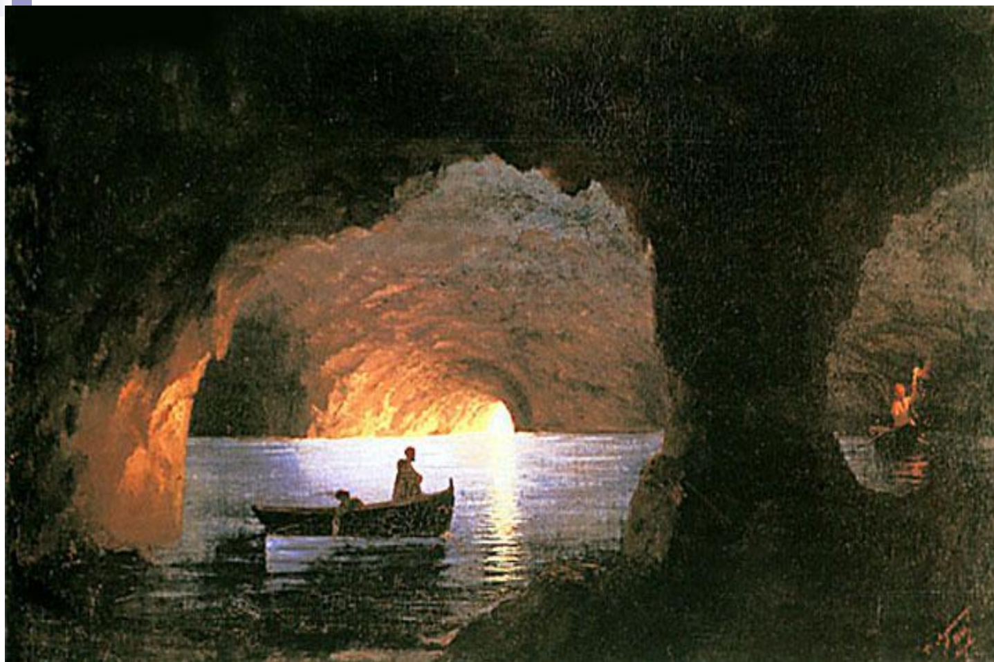
Лазоревый грот 1841

Именно море обычно предстает у него универсальной основой природы и истории, особенно в сюжетах с сотворением мира