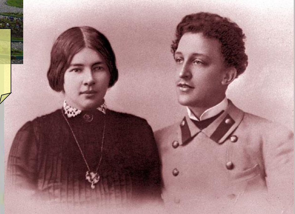
А.Блок с Любовью Менделеевой

Стихи о прекрасной даме Александр Блок 1905