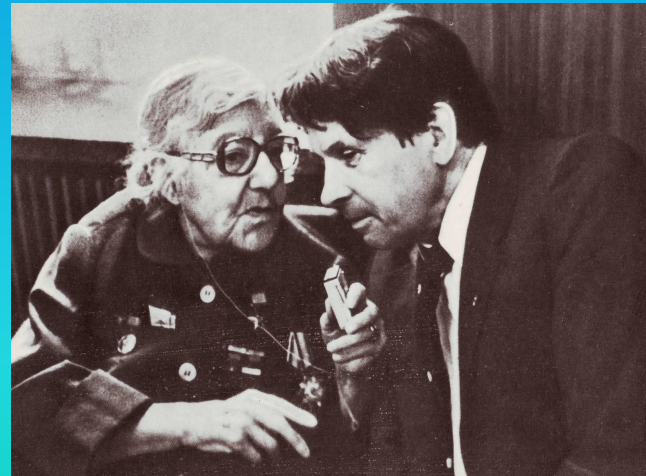
Фёдор Абрамов и Мариэтта Шагинян