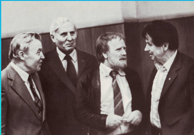
Ф. Абрамов (крайний справа) среди писателей на съезде.

Ф. Абрамов был дружен со многими известными людьми того времени. Среди них были писатели и поэты, артисты и режиссёры, композиторы и государственные деятели.