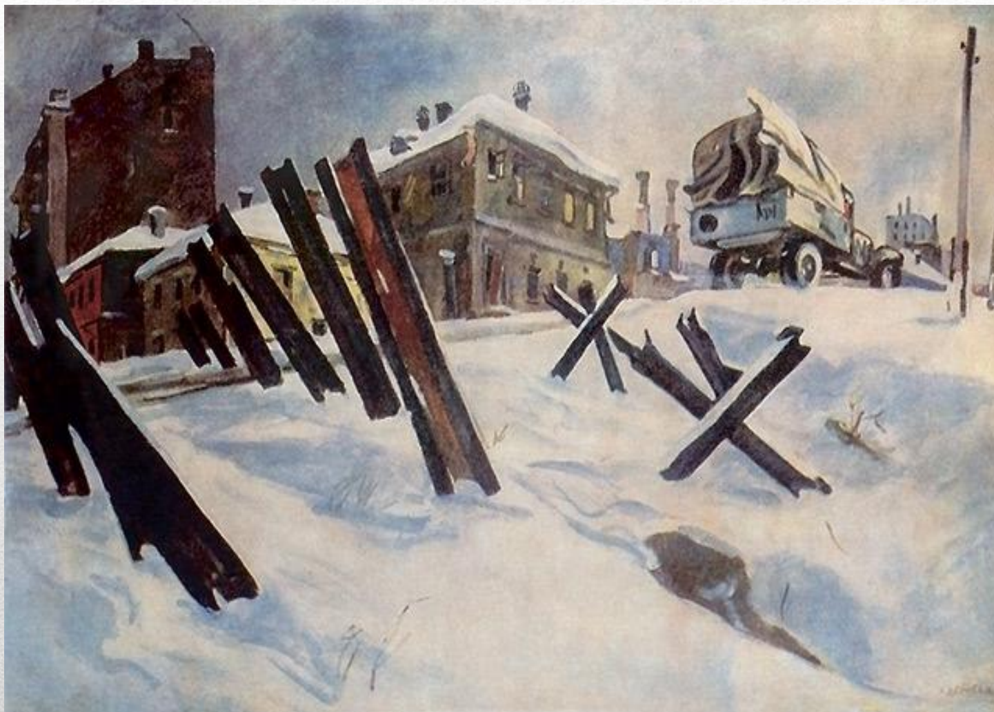
А.А.Дейнека «Окраина Москвы. Ноябрь 1941 года»