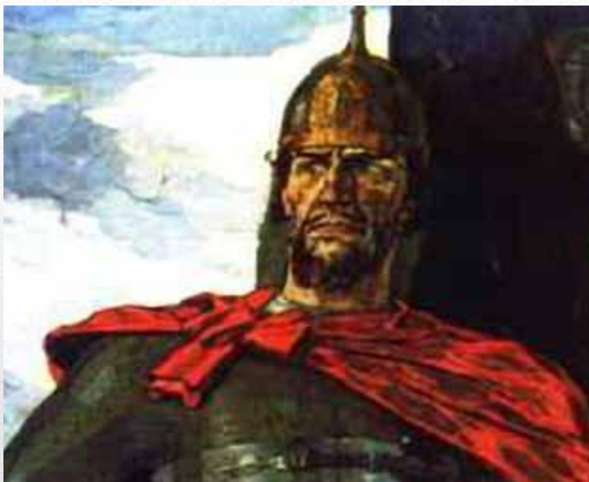
П.Д.Корин «Александр Невский»