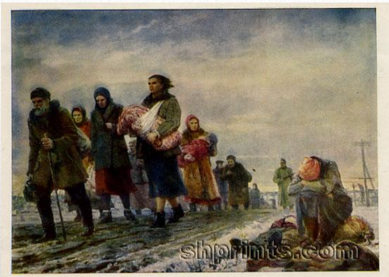
Г. Г. Рязжский «В рабство» (1942; Николаевский государственный художественный музей