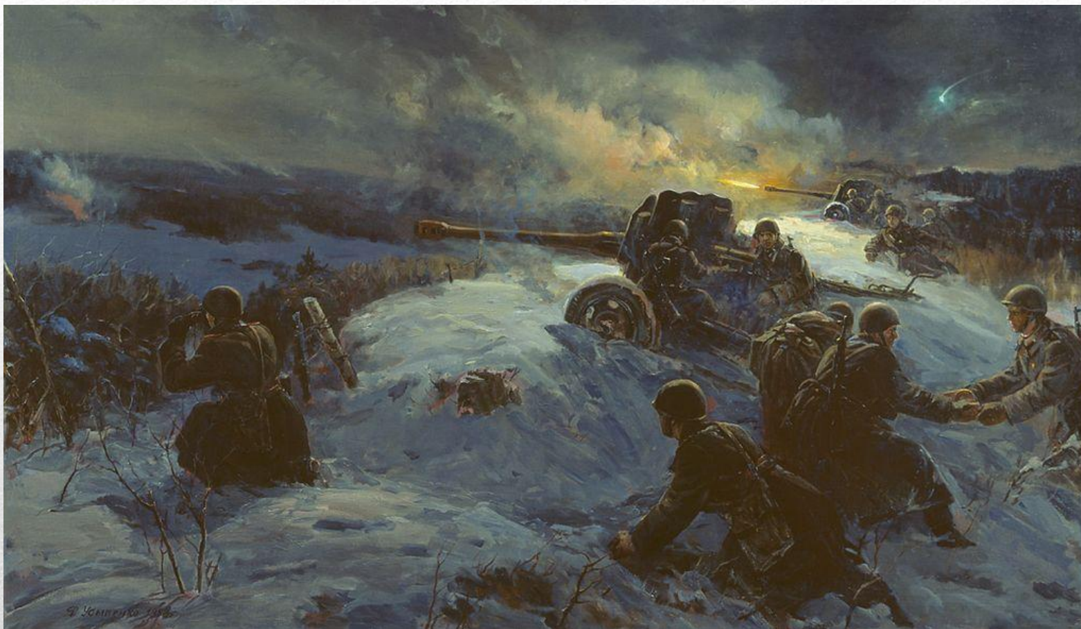
Ф. Усыпенко «Ночной бой»