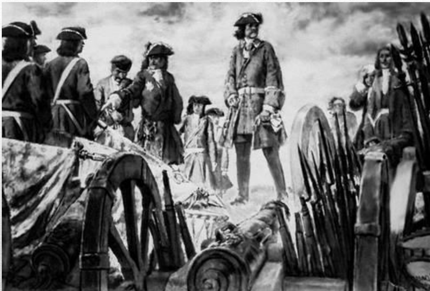
Е.Е.Лансере «Полтавская победа» (1942; Третьяковская галерея)