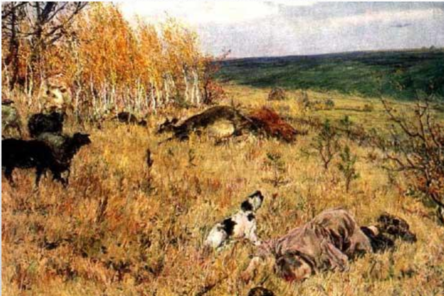
А.А. Пластов «Фашист пролетел»