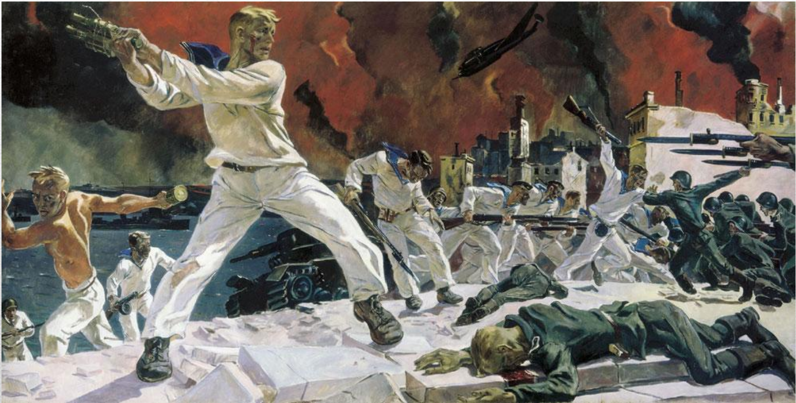
А.А.Дейнека «Оборона Севастополя»

Художники обращались и к знаковым, знаменательным событиям, решающим моментам войны. Сцены сражения, героизма и самопожертвования ради победы не редко становятся основополагающими их работ.