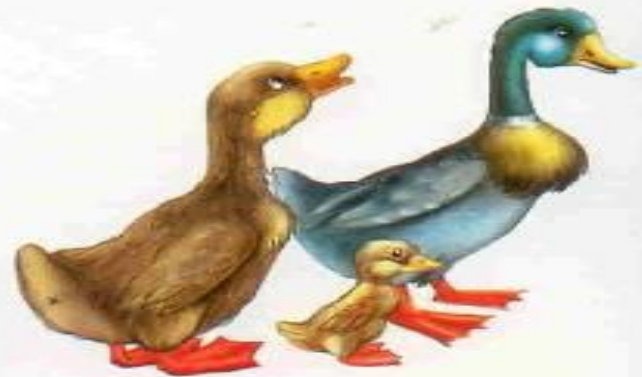
Утка — селезень — утёнок