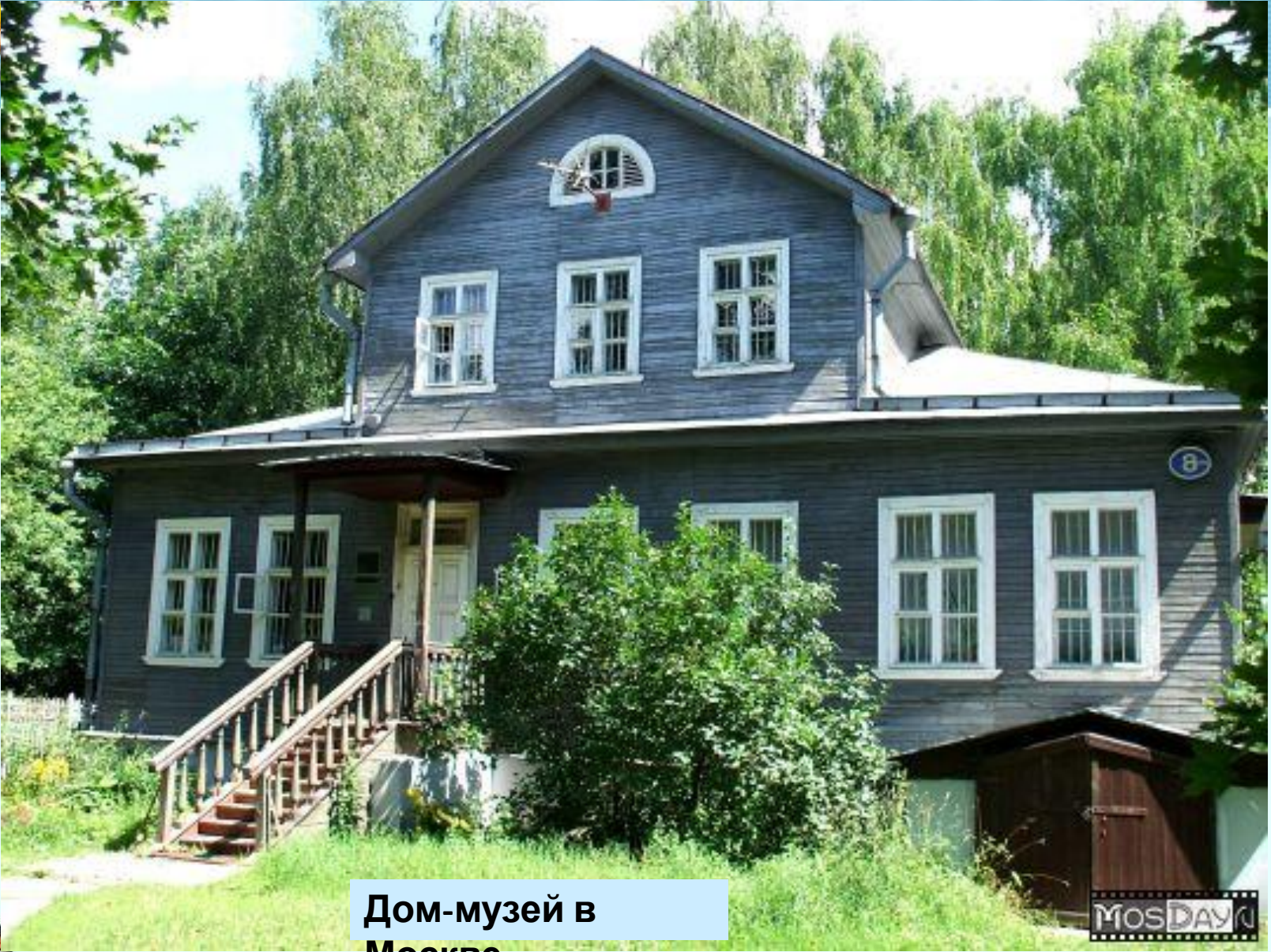
Дом-музей в Москве