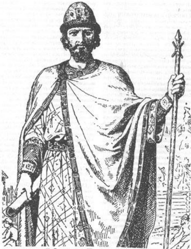
Юрий Владимирович Долгорукий, первый ростовский князь. Современный рисунок

Ростовская земля вместе с Переяславской отошла третьему сыну Ярослава Мудрого – Всеволоду.