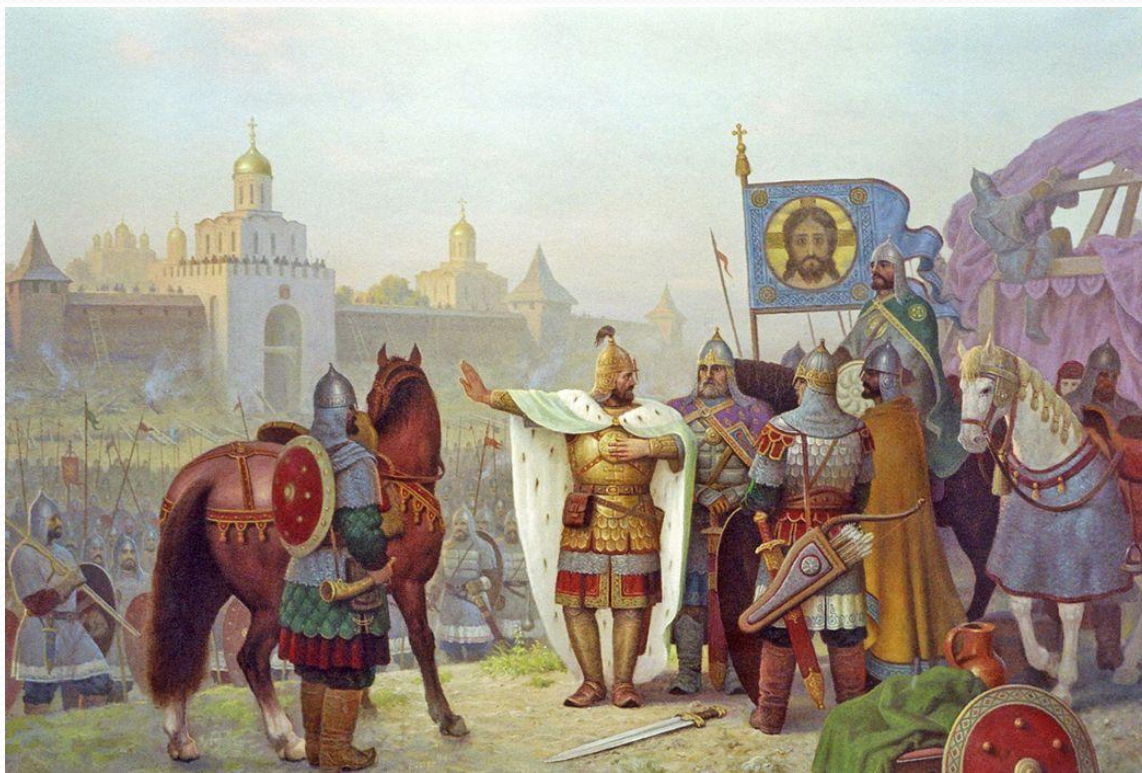
Юрий Долгорукий у стен Владимира. Худ. В.М. Тормасов.