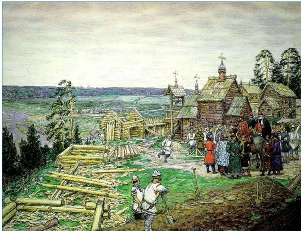
Основание Москвы на Боровицком холме. Худ. А.М. Васнецов

Юрий правил в Киеве в 1149–1150 гг. и в 1155–1157 гг. В 1150–1154 гг. киевским князем был Изяслав Мстиславич.