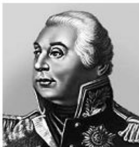
М. И. Кутузов