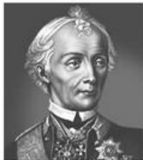
А. В. Суворов