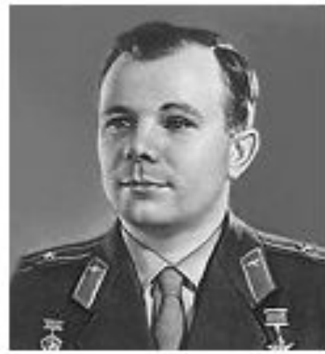
Ю. А. Гагарин