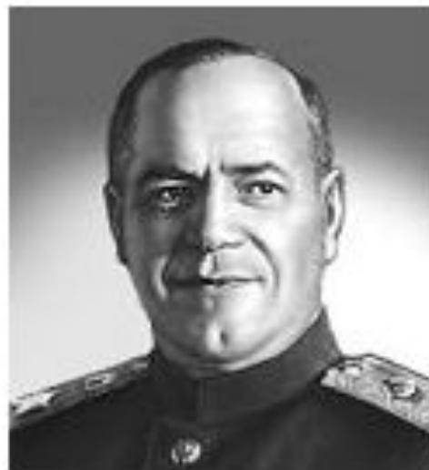
Г. К. Жуков