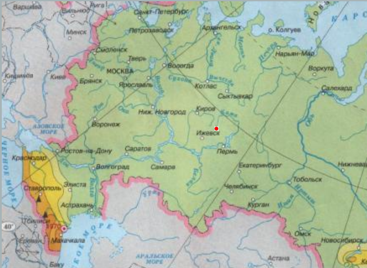
Владимировна - учитель

Все реки имеют место, где они впадают в другую реку, озеро или море. Называют его устьем . Кама впадает в Волгу.