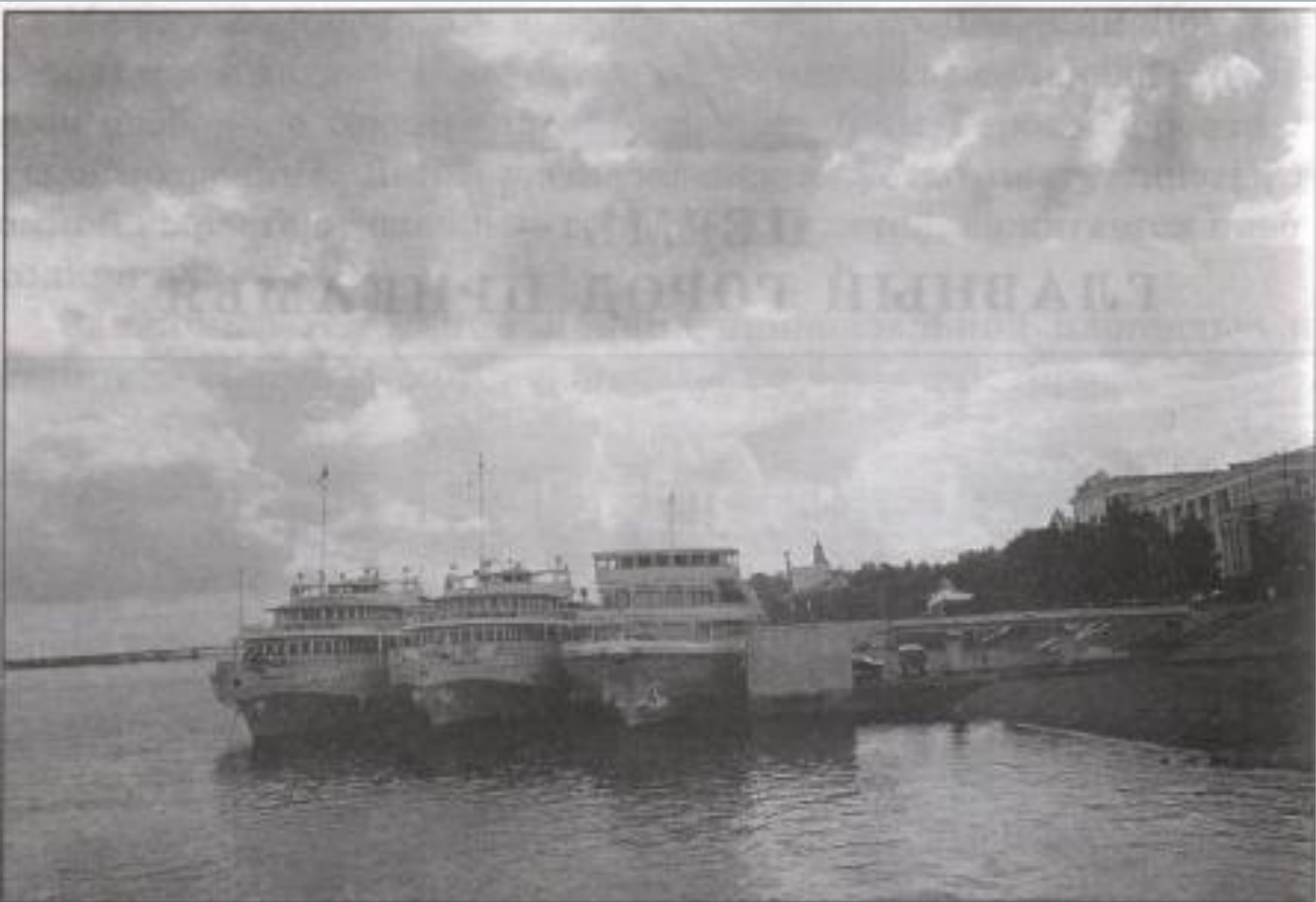
У камского причала