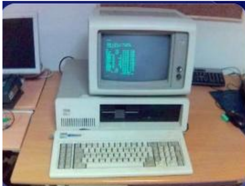
Персональний комп'ютер IBM PC/XT

Функціональна частина ЕОМ, що призначена для інтерпретації команд.