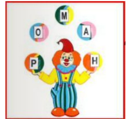
«Клоун» чтение слова