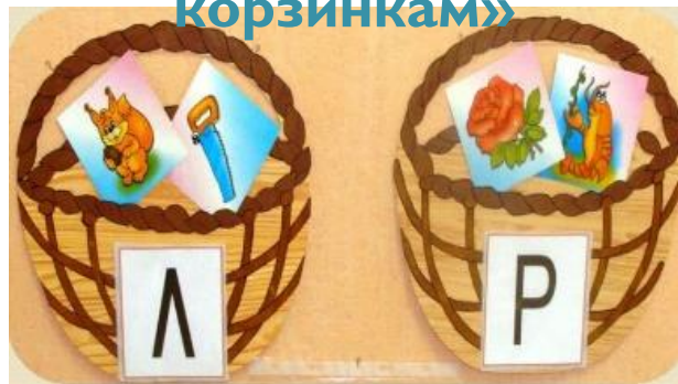
«Картинки по корзинкам»