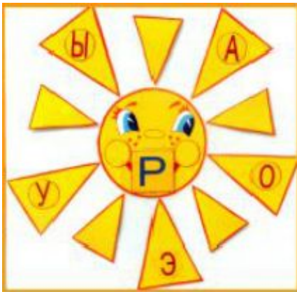
«Солнышко» Чтение слогов