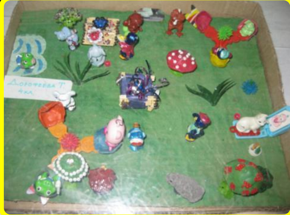
Выставка детского творчества