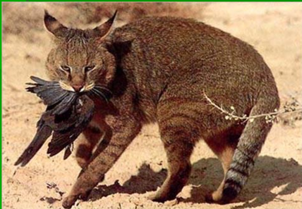
■ Камышовый КОТ