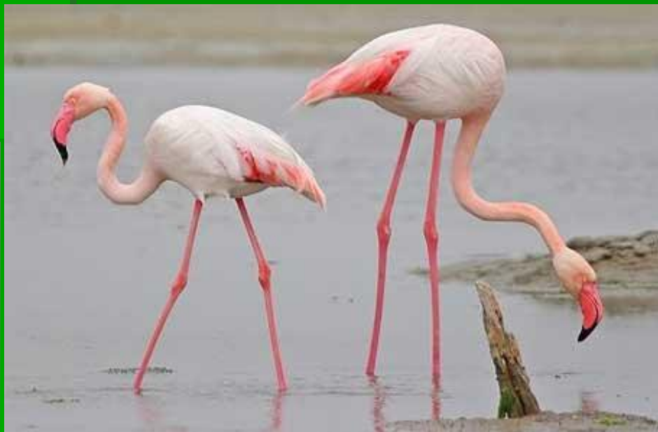
■ Розовый фламинго