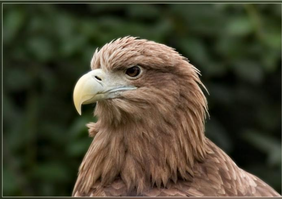
■ Степной орёл