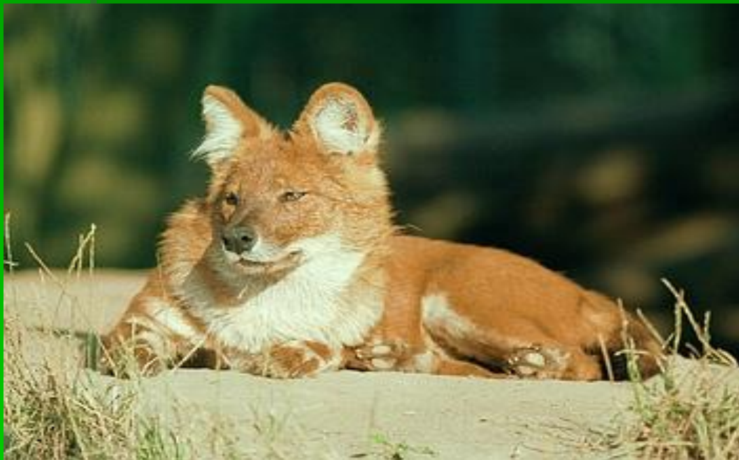
■ Красная лиса