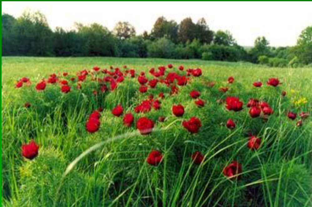
■ Пион тонколистый