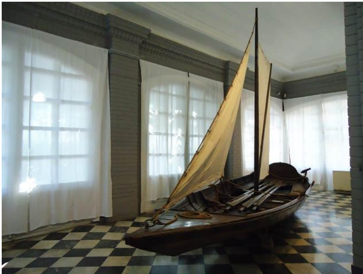
Лодка-верейка. Построена Петром I. Начало XVIII века.

В экспозициях можно увидеть построенную самим императором лодку-верейку, подлинные трофеи морских побед, материалы об основании города, о событиях в Северной войне.