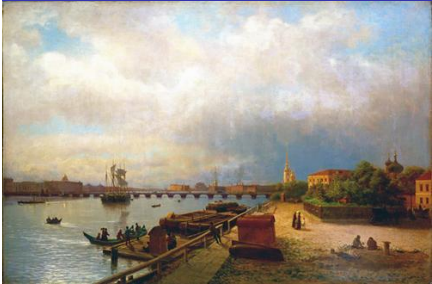
Вид на Неву и Петровскую набережную с Домиком Петра I. Л. Ф. Лагорио. 1859 г.

В 1703 году Петр I возглавил русские войска для освобождения захваченных шведами русских земель. Когда земли были отвоёваны, необходимо было построить крепость для их защиты. На Заячьем острове было возведено такое фортификационное сооружение.