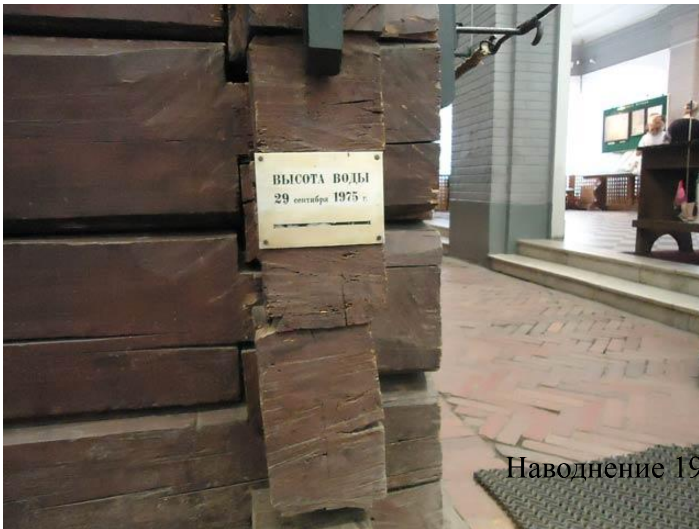
Наводнение 1975 г.

Согласно официальной истории, гранитная набережная была сооружена только в 1901-1903 годах, при этом была отодвинута в Неву приблизительно на 30 метров. До этого времени набережная была укреплена деревом.