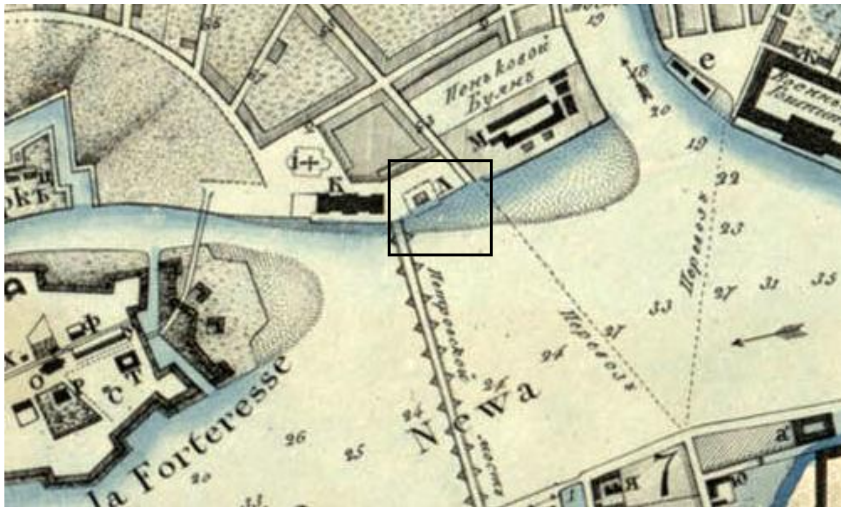
План Санкт-Петербурга. Фрагмент. Домик Петра обозначен буквой "Л".