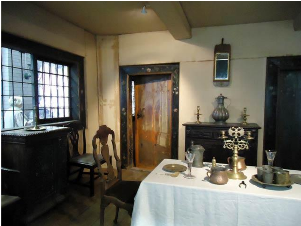
Столовая. Двери с захваченных шведских кораблей.

Планировка царской резиденции была простой: 2 "светлицы" (кабинет и столовая), разделённые сенями и спальней. Петр I периодически жил во "дворце" с 1703 по 1708 год во время своих визитов в строящийся Петербург.