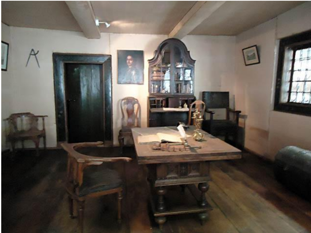
Рабочий кабинет. Кресло возле стола смастерил сам Пётр I.

Здесь выставлены личные вещи императора — красного сукна мундирное платье, курительная трубка, изготовленная из самшита, восточной работы трость с позолоченной ручкой.