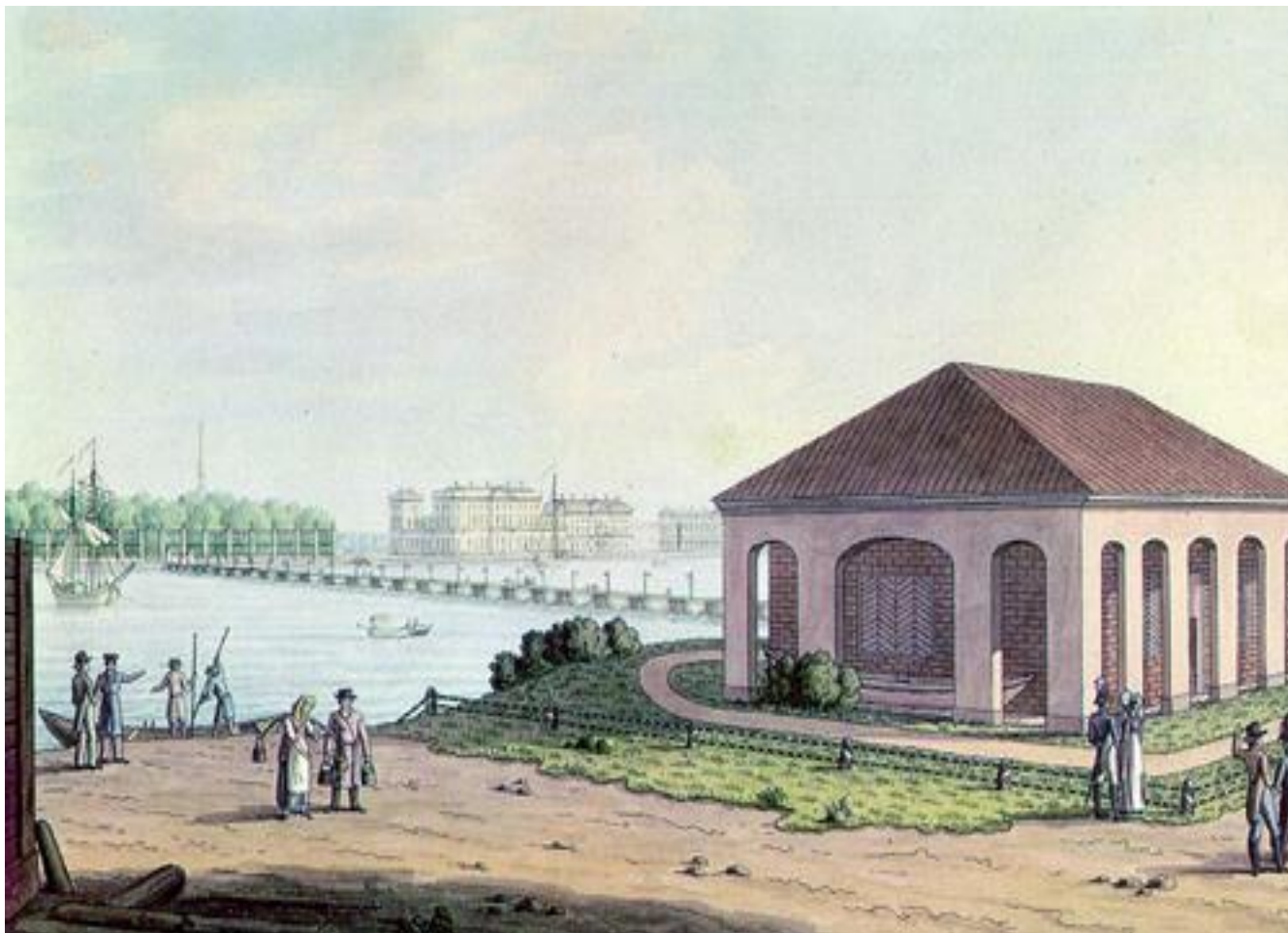
Вид от домика Петра I на Летний сад и Дворцовую набережную. 1820-е годы.

Климат Петербурга разрушительно действовал на первый петербургский дворец Петра, и уже в 1723 году по указу царя домик был окружен защитной галереей с крышей. Выполнил эту работу Доменико Трезини.