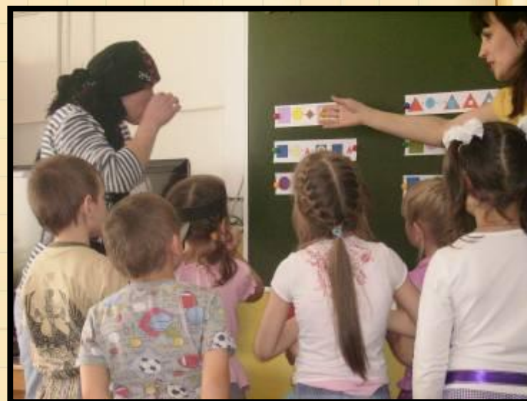
Технология игровой обучающей ситуации