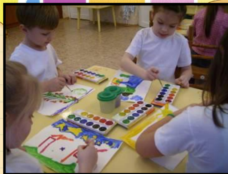
Арт - технология