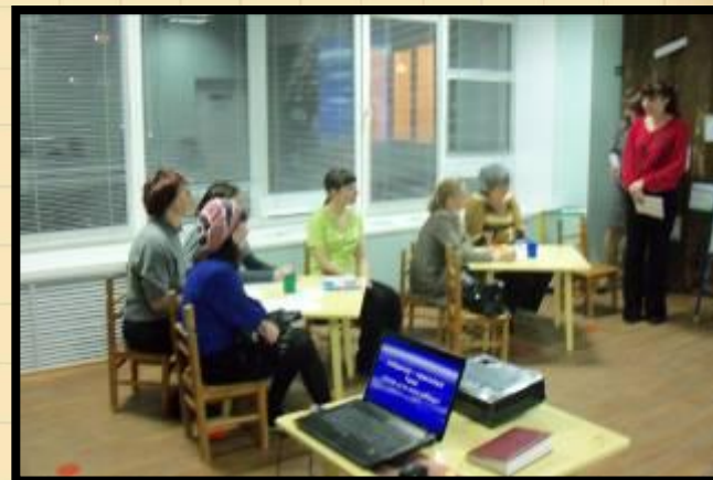
Консультация «Знаете ли вы своего ребенка?» 2010