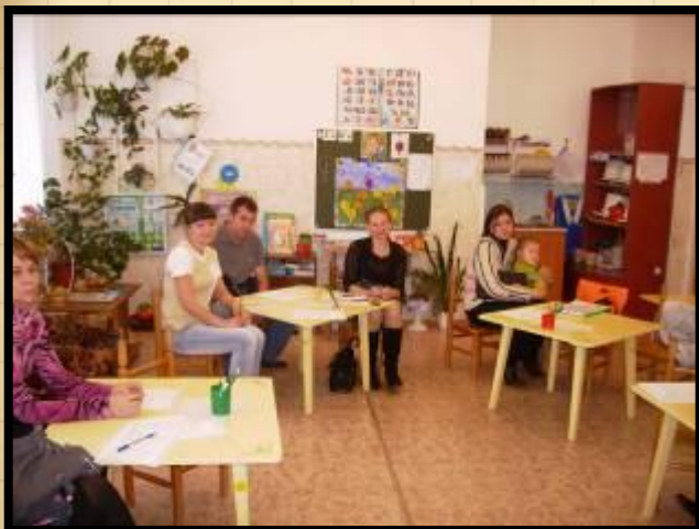
Собрание «Секреты психологического здоровья» 2009