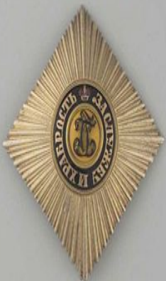
Знак 4-й степени