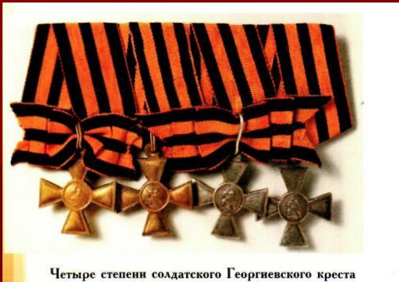
Четыре степени солдатского Георгиевского креста