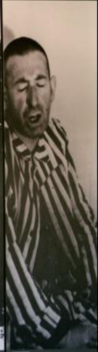
Small, illegible text caption at the bottom left of the first panel.