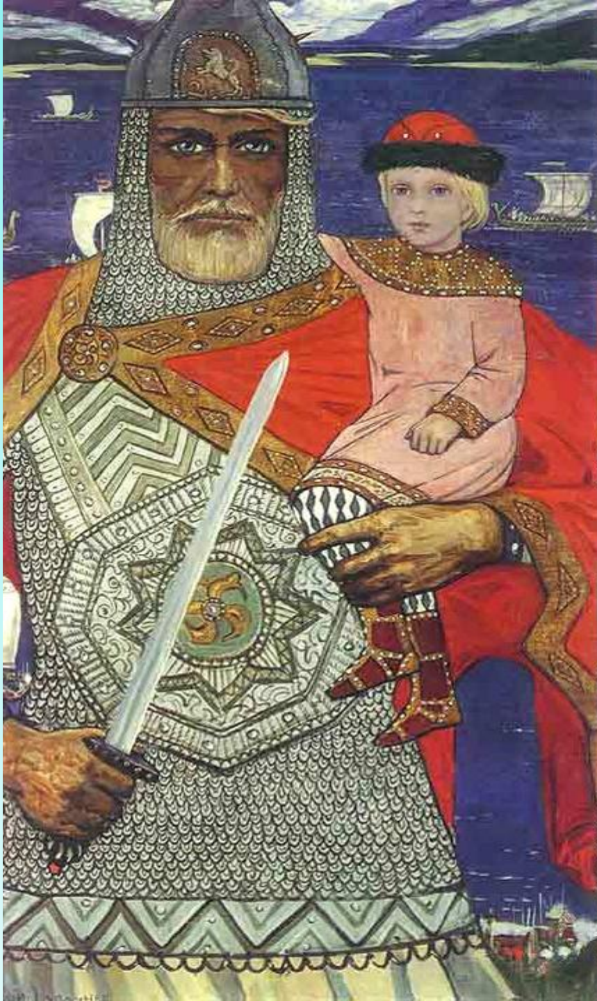
И. Глазунов «Князь Олег и Игорь»