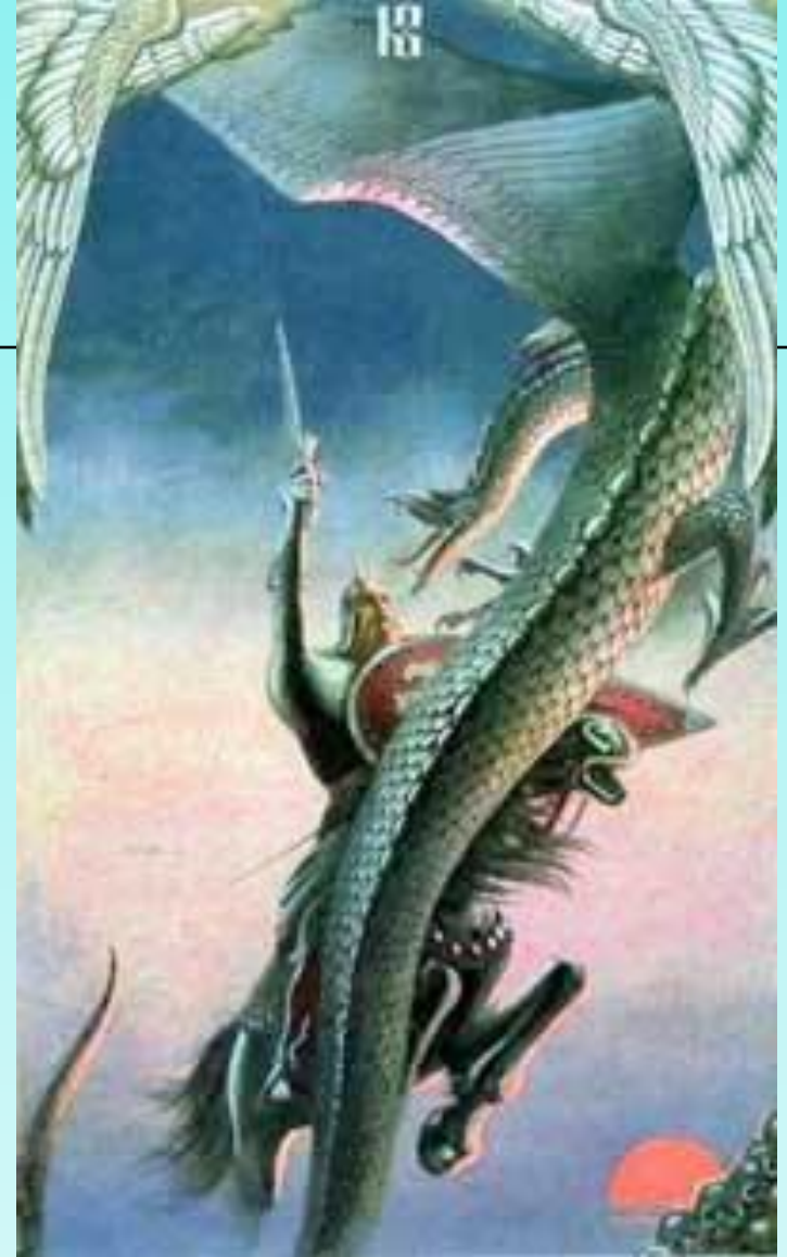
Виктор Васнецов «Бой Добрыни Никитича с семиглавым Змеем Горынычем»