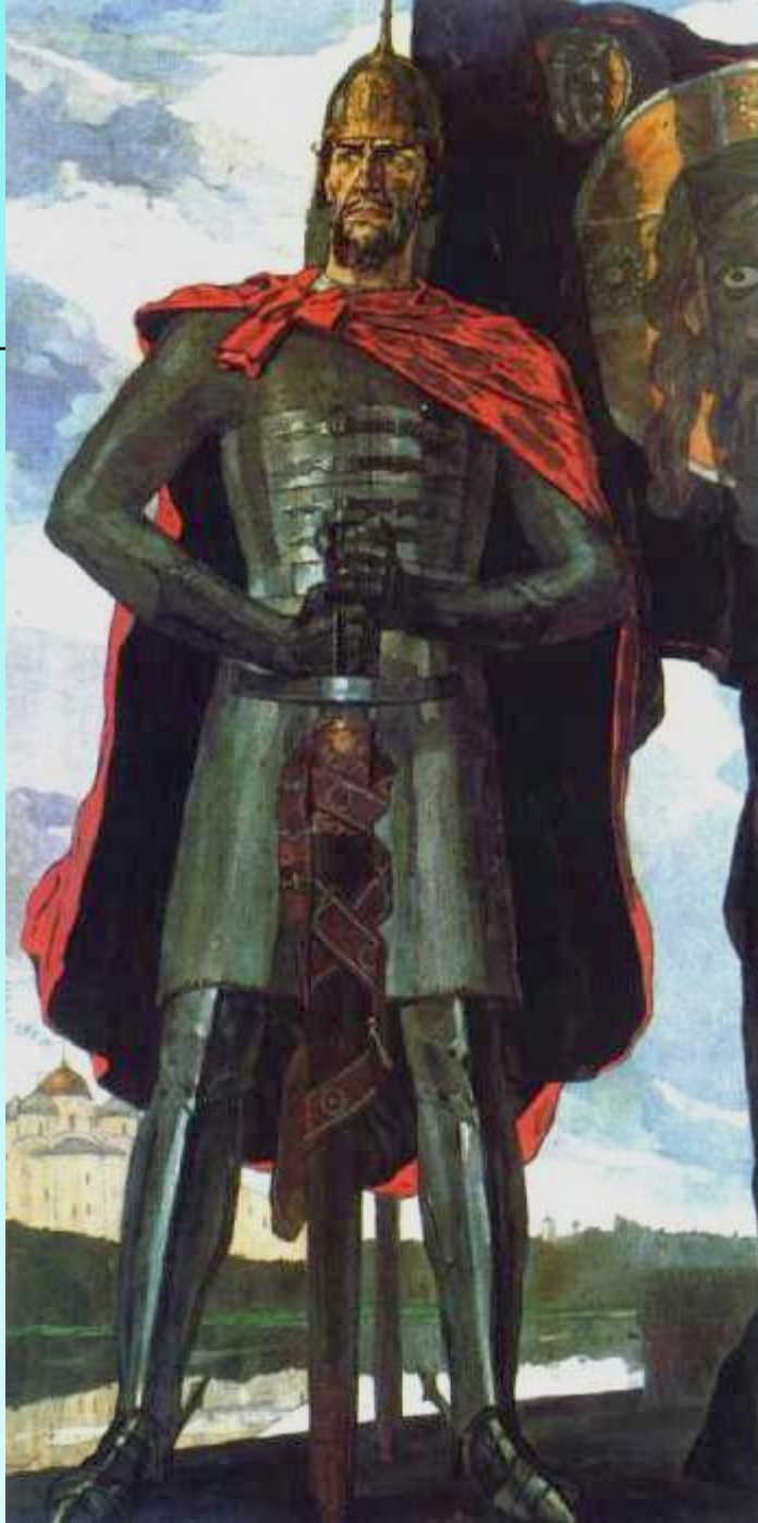
П. Д. Корин «Александр Невский»