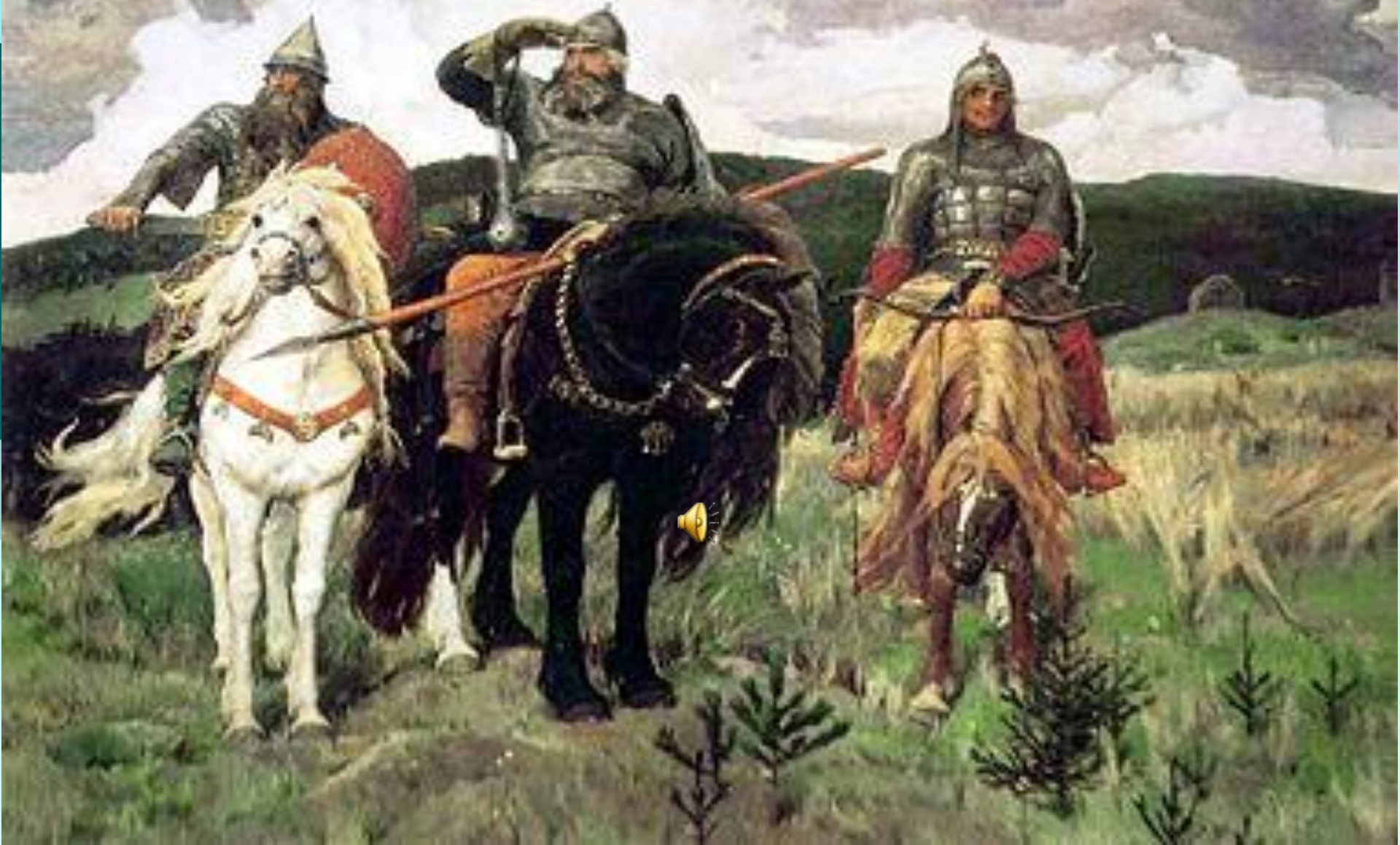
В. М. Васнецов "Богатыри"