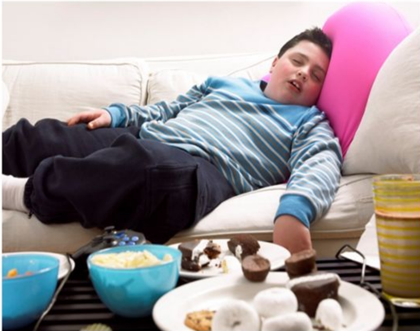
Surprisingly accurate depiction of Lardass post whack-off