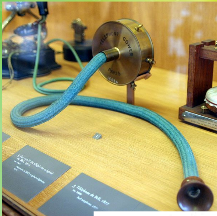
Телефон 1896 года (Швеция)