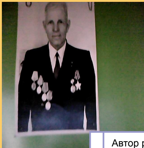
Автор работы ученица 3 «б» класса: Анфимова Снежана.