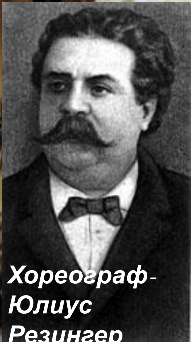
Хореограф- Юлиус Резингер