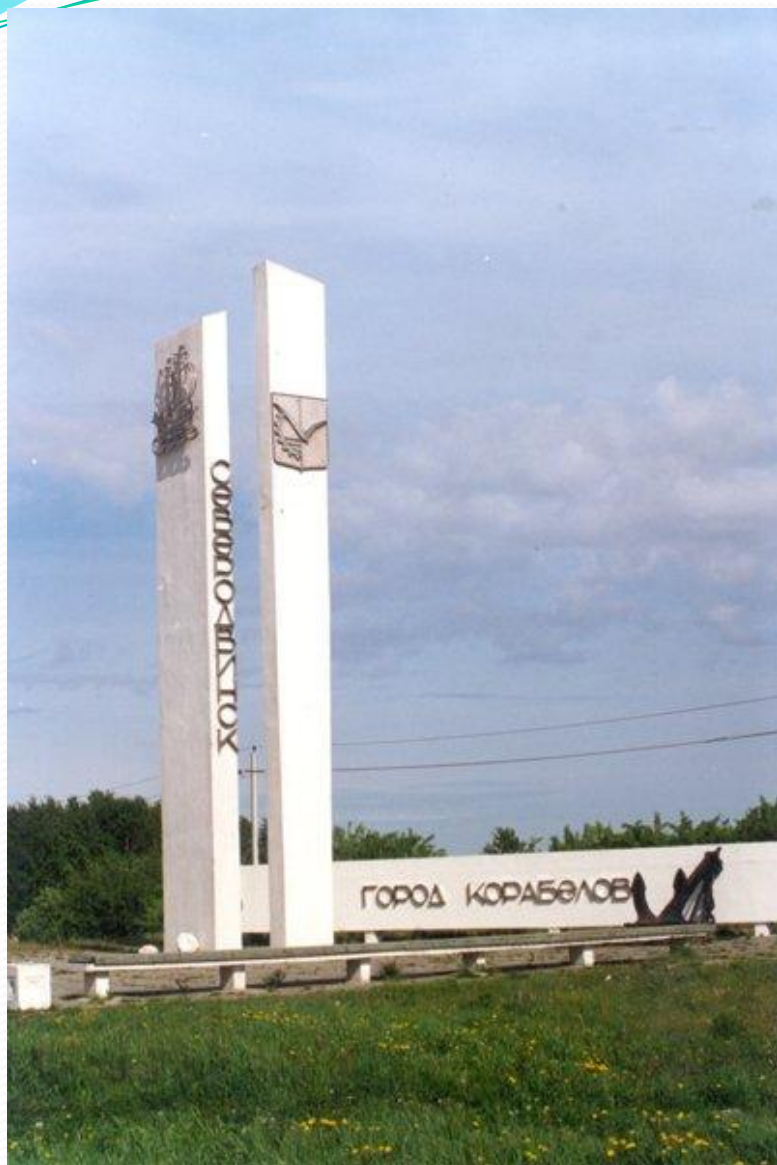
Стела – памятный знак города