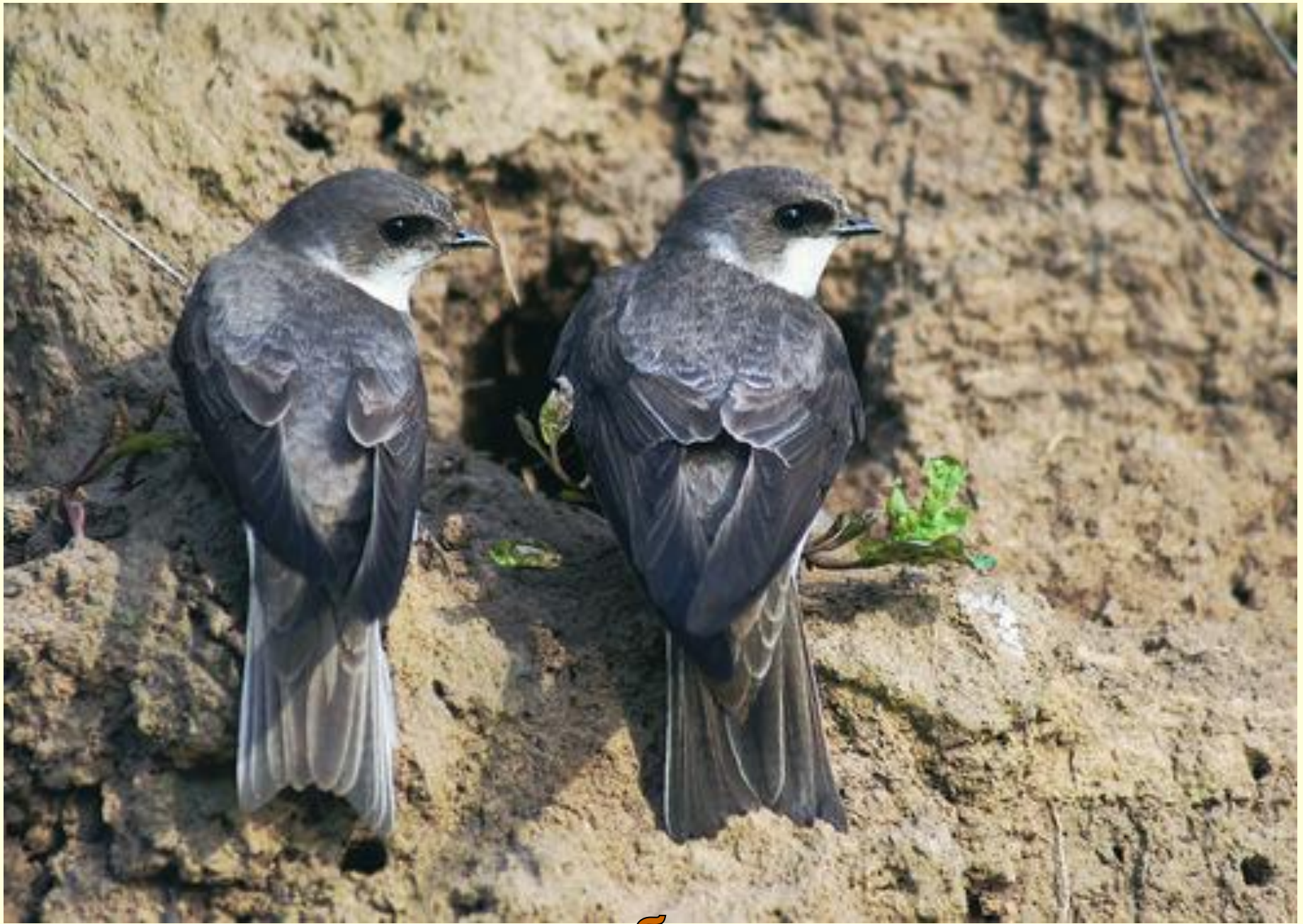
ласточки - береговушки