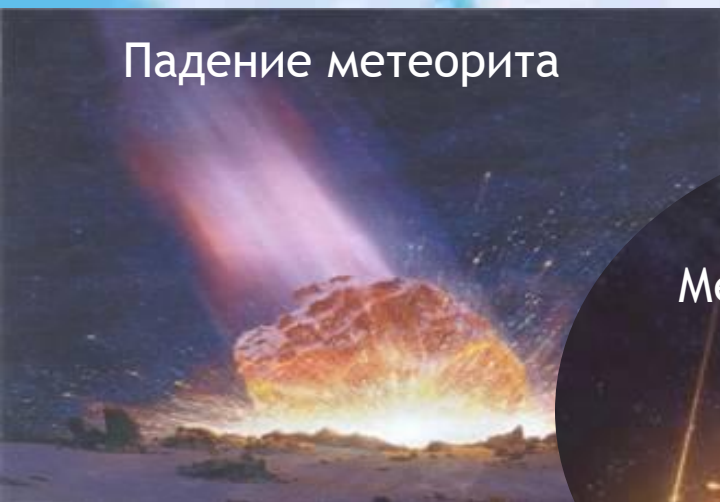
Сгорание метеорита в атмосфере Земли