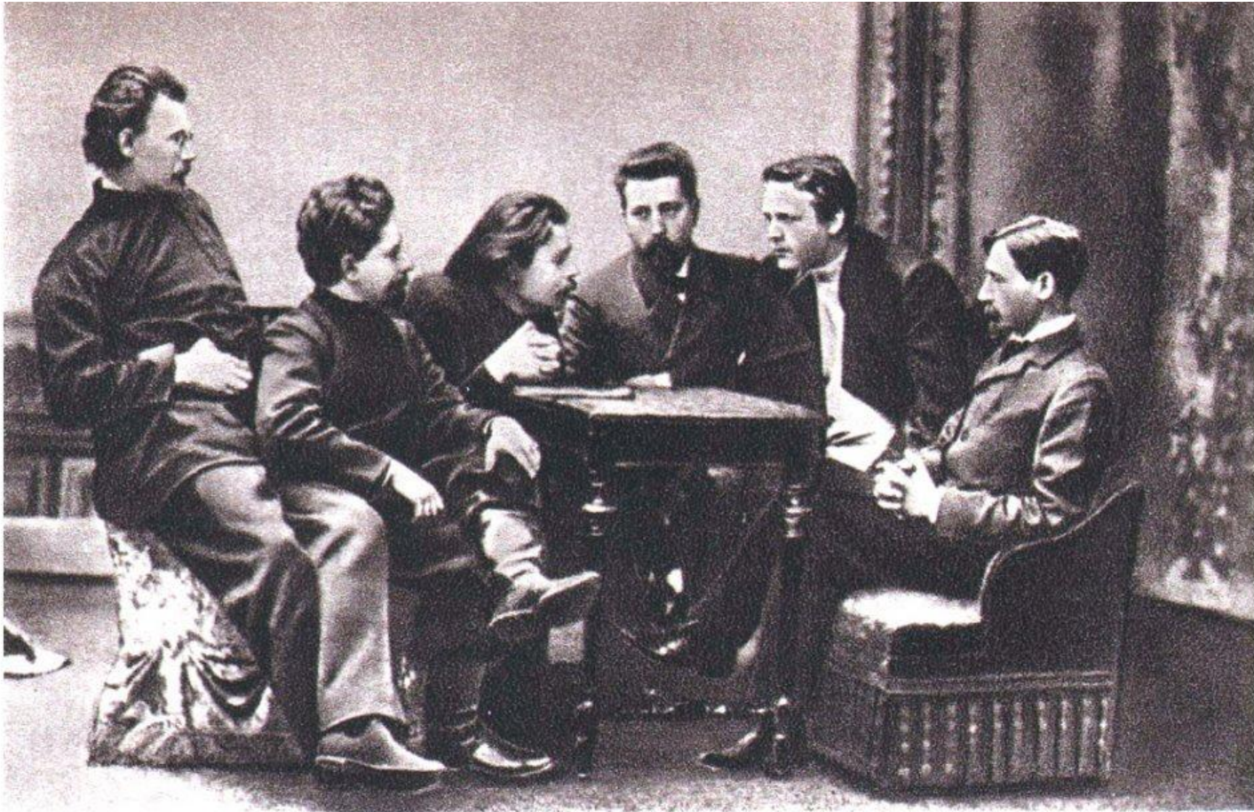
С. Г. Скиталец, Л. Н. Андреев, А. М. Горький, Н. Д. Телешов, Ф. И. Шаляпин, И. А. Бунин 1902 г.