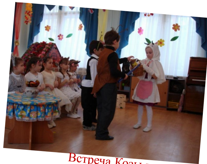
Встреча Козы и муравьёв