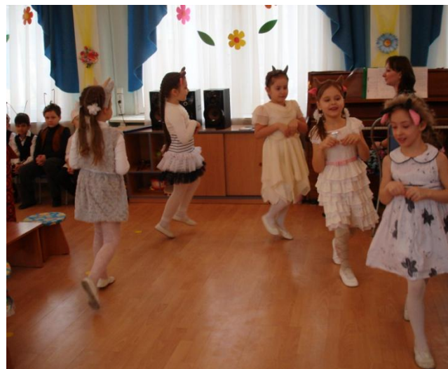
Козлята на лужайке ждут маму Козу