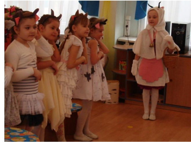
Сцена «возвращение Козы домой»