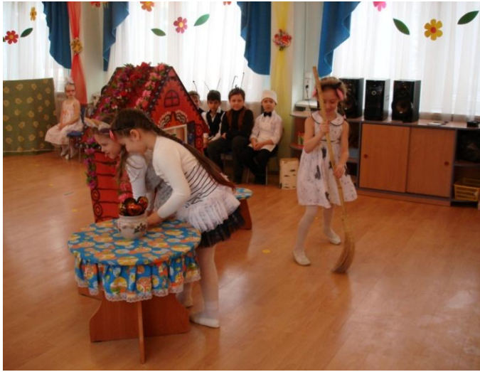
Сцена «Козлята убирают свой дом»