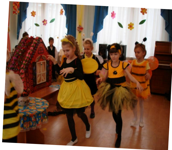
«Танец пчел» Композиция Т.Бурениной