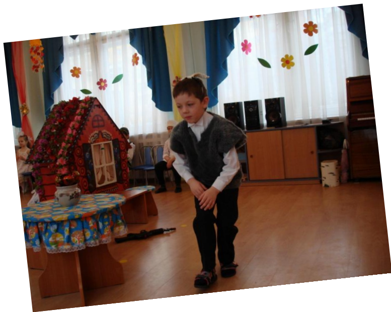
Сцена «Волк крадется к домику козлят»