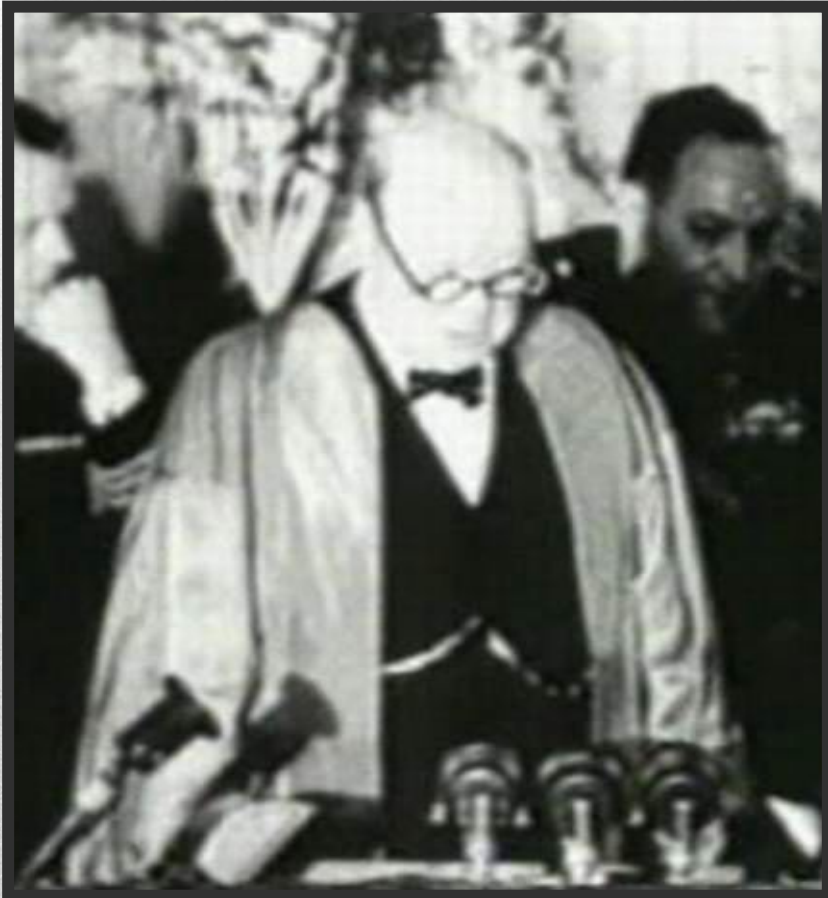
Вестминстерский Колледж, Фултон, штат Миссури (США), 5 марта 1946 г.

Началом «холодной войны» принято считать речь Уинстона Черчилля в г. Фултоне (США) 5 марта 1946 г.