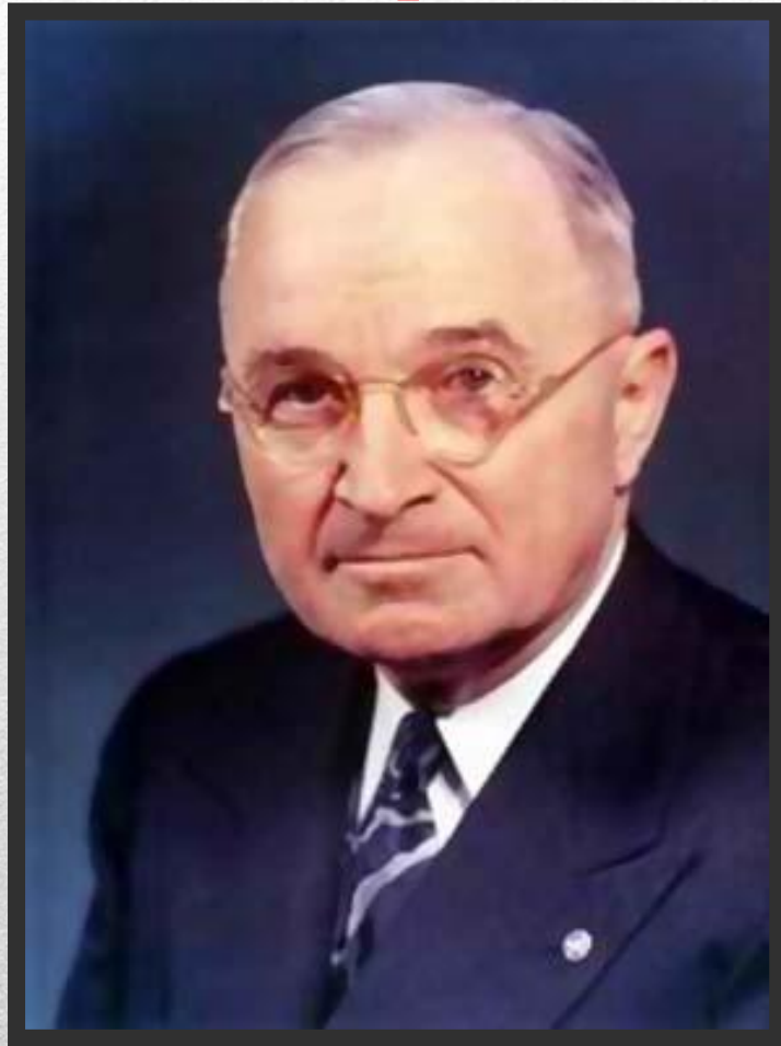
Гарри Трумэн президент США (1945 – 1953 г.г.)