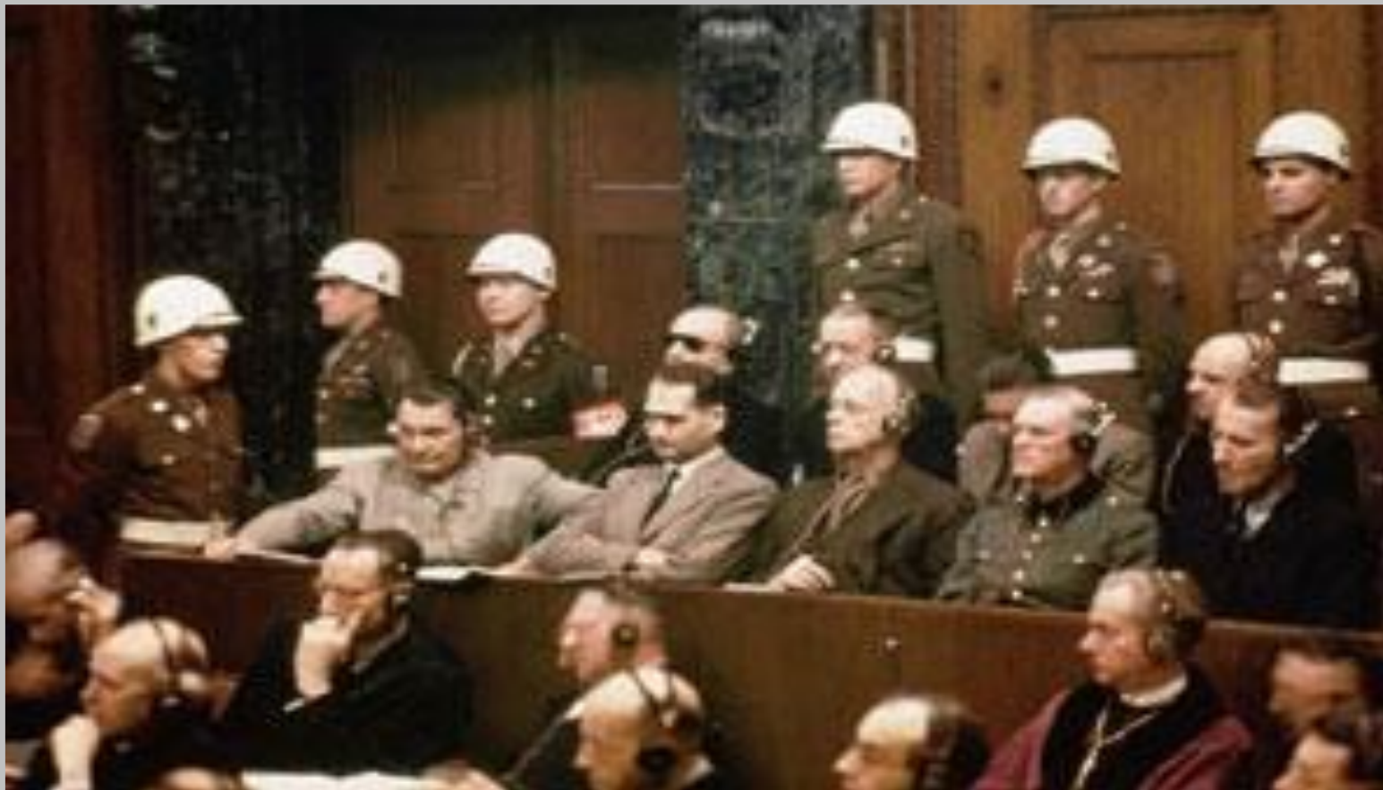
Нацистские преступники на скамье подсудимых

Главным нацистским военным преступникам было предъявлено обвинение в заговоре против мира путём подготовки и ведения агрессивных войн, в военных преступлениях и преступлениях против человечности.