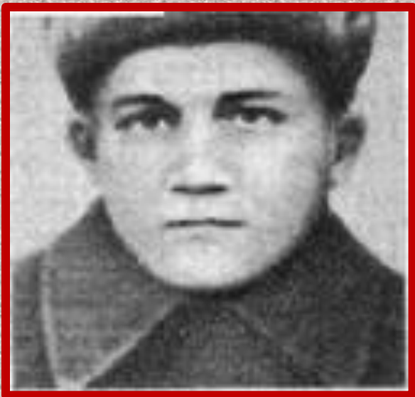
Валерий Волков (1929 — 1 июля 1942 года, Севастополь) — пионер-герой, разведчик.