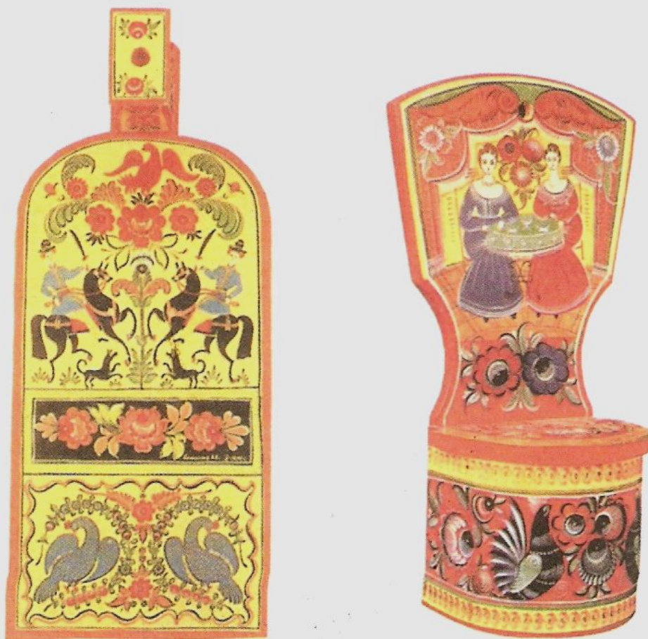
Изделия с городецкой росписью