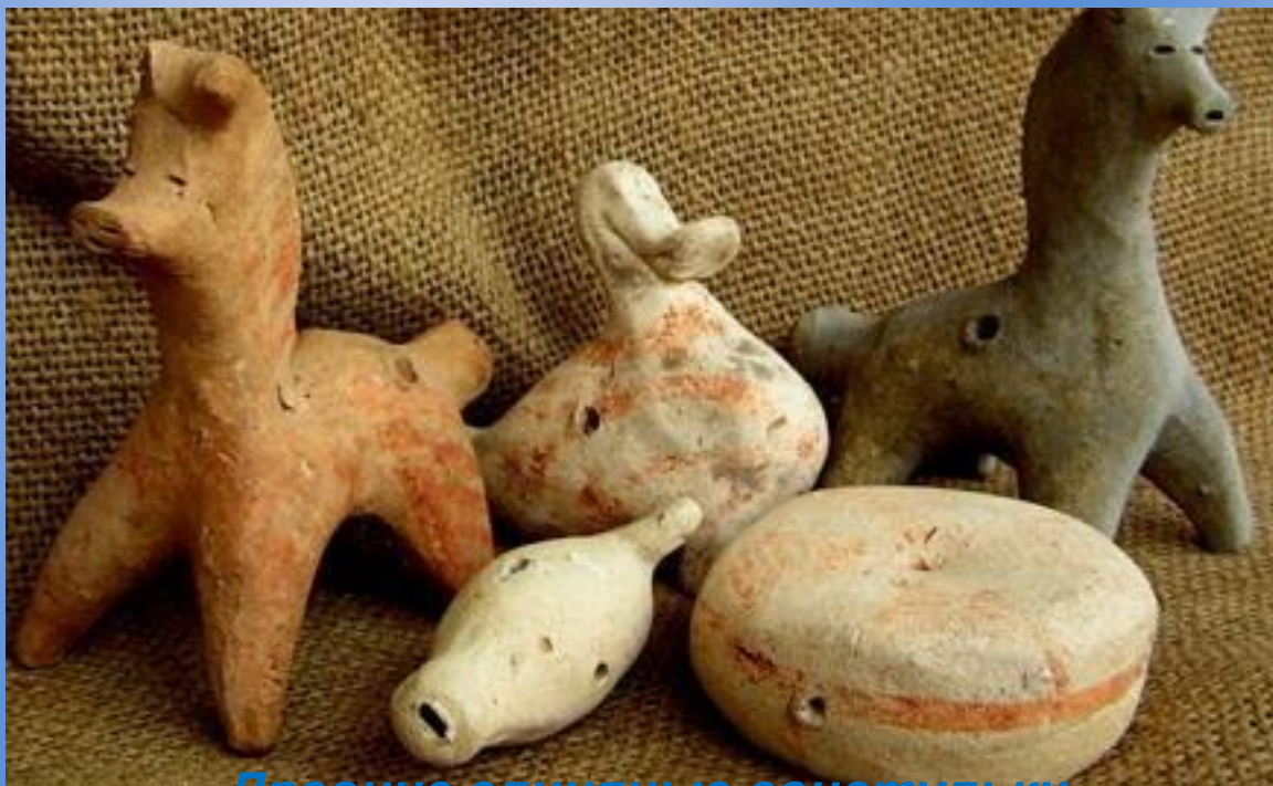
Древние глиняные свистульки

Свистульки – переманивали на себя хворь. Они часто изображали то или иное животное. В обычное время они стояли напротив окна, "не пропуская" болезнь и зло к ребенку.