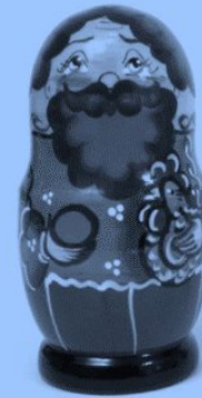
Первая русская матрешка. Конец XIX в.