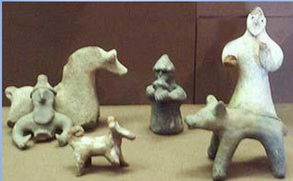
Игрушки XV-XVII вв., найденные на территории глиняной слободы в Москве.