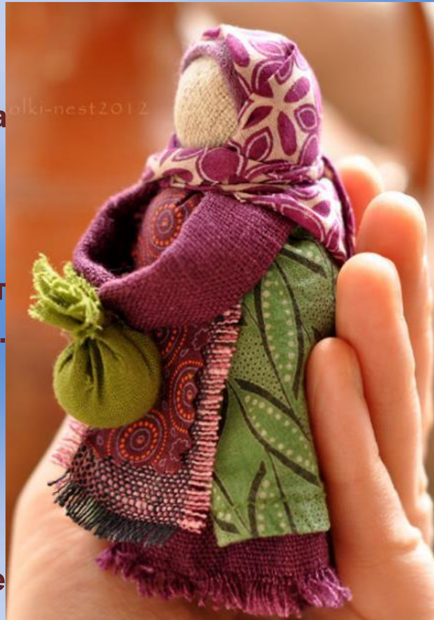
Подорожница - оберег в дорогу

Были и просто обыкновенные игровые куклы, с которыми играли дети.