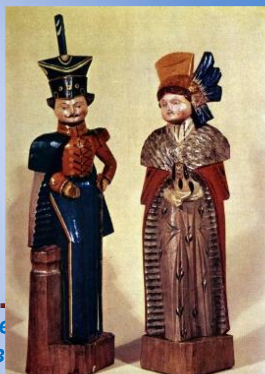
Барыня. гусар. XIX в. Дерево