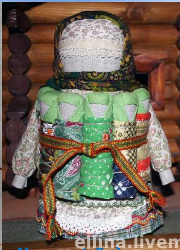
Мсковка («Седьмая Я»)