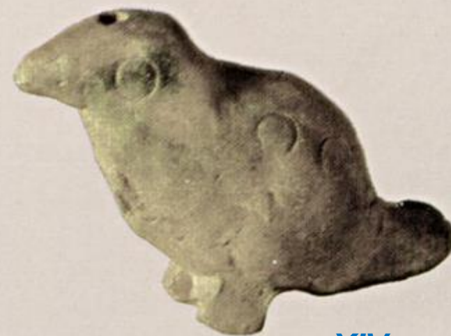
Свистулька-птичка. XIV в.

В русской игрушке нет отрицательных персонажей.