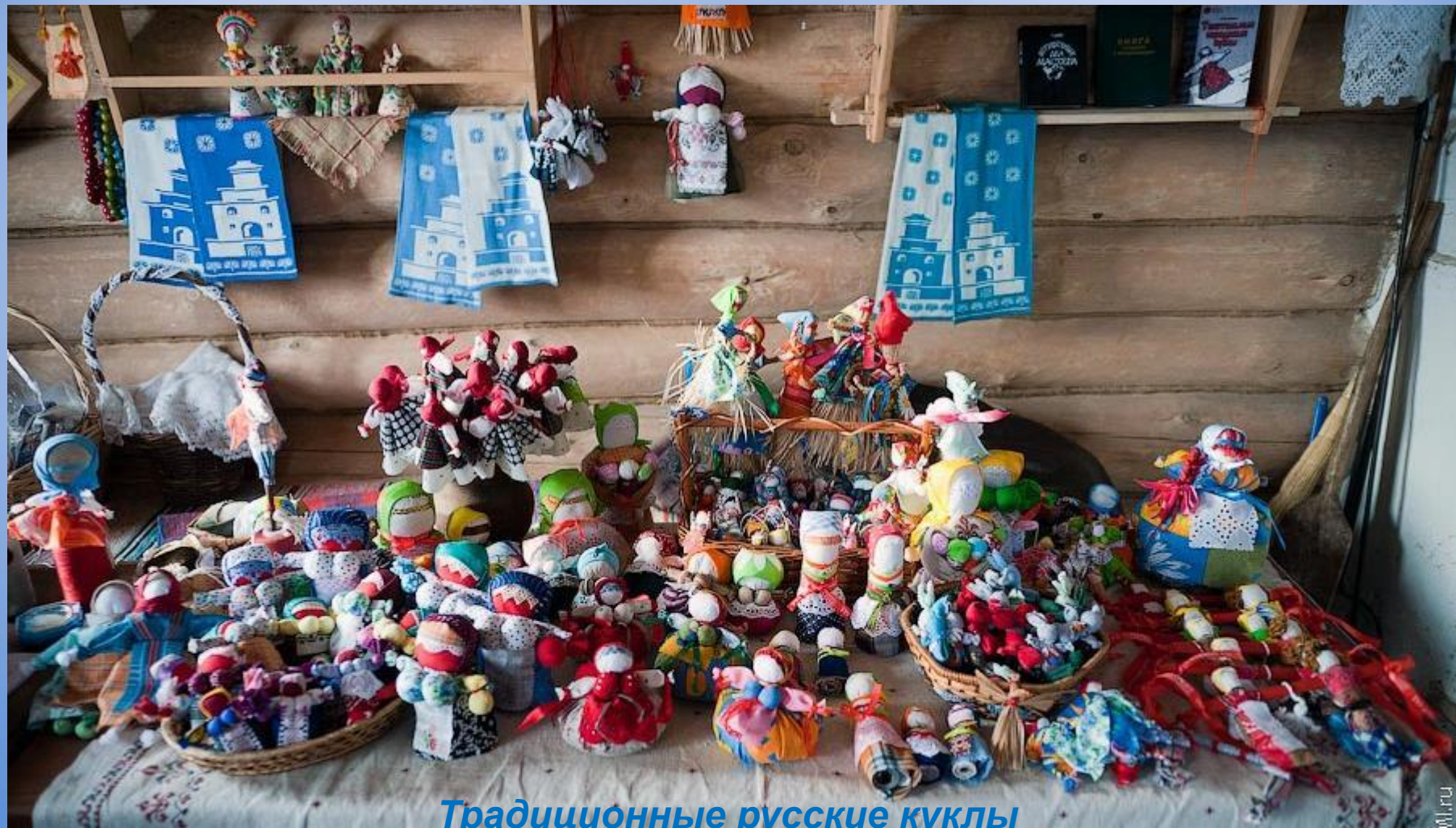
Традиционные русские куклы

Примером ритуального предмета детской игры являются традиционные русские куклы, которые не имеют прорисовки лица. Существует три больших группы кукол: обереговые, обрядовые и игровые. На изготовление