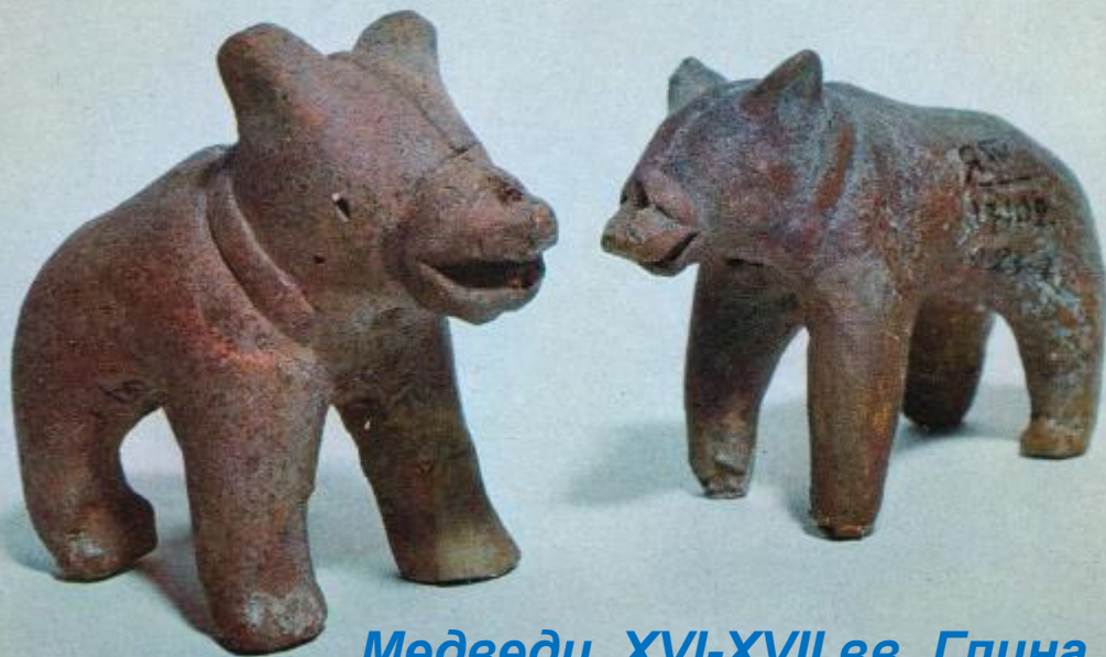
Медведи. XVI-XVII вв. Глина