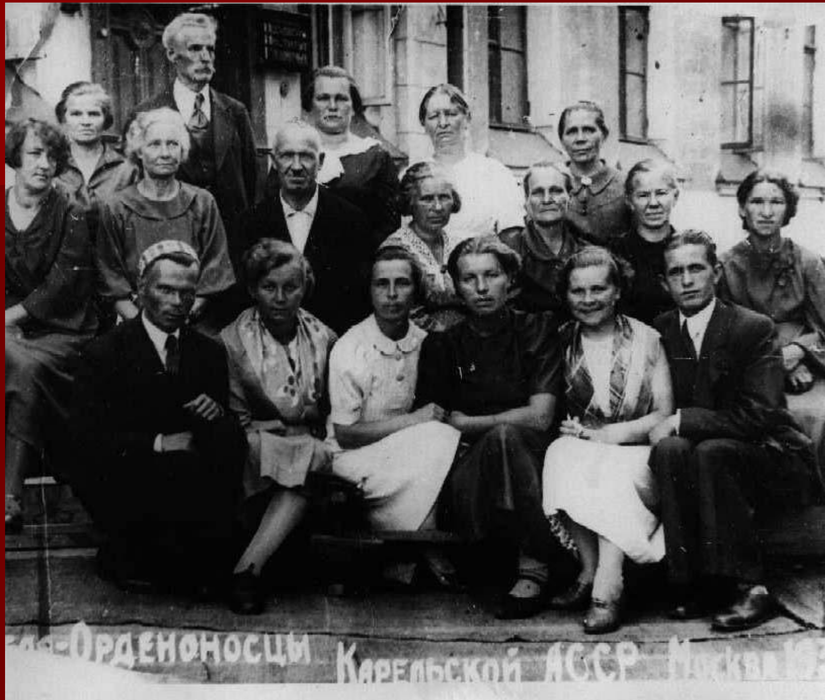
Орденосцы Карельской АССР Москва 1950