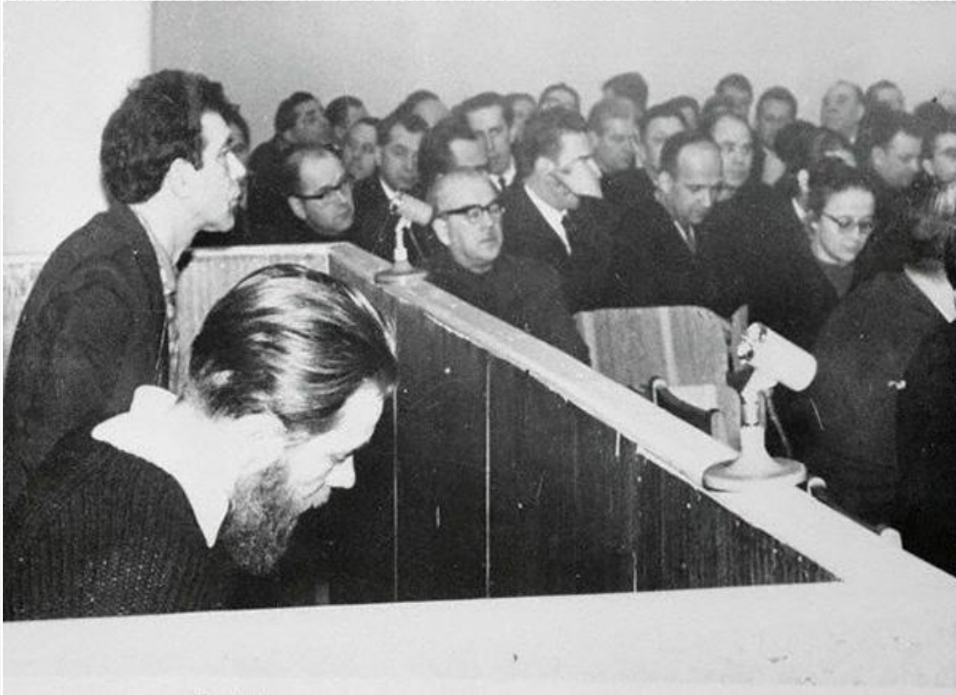
Ю. Даниэль и А. Синявский в зале суда