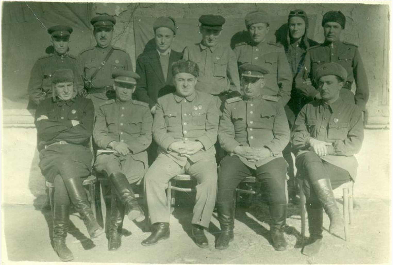
Делегация трудящихся Грузии в 18-й армии. Начальник политотдела 18-й армии Л. И. Брежнев в верхнем ряду, крайний справа.