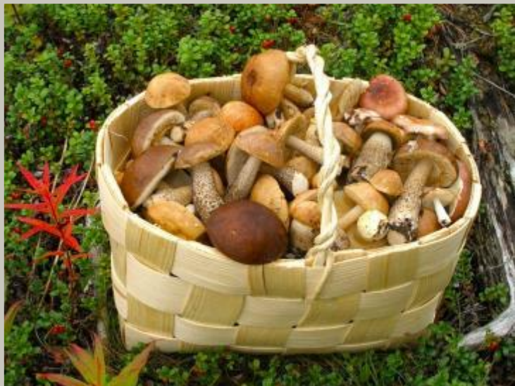
Лукошко с грибами

Издавна из бересты крестьяне плели лукошки и туески для ягод и грибов, делали берестяные рожки, на которых играли пастухи, уводя стадо коров с пастбища в деревню.