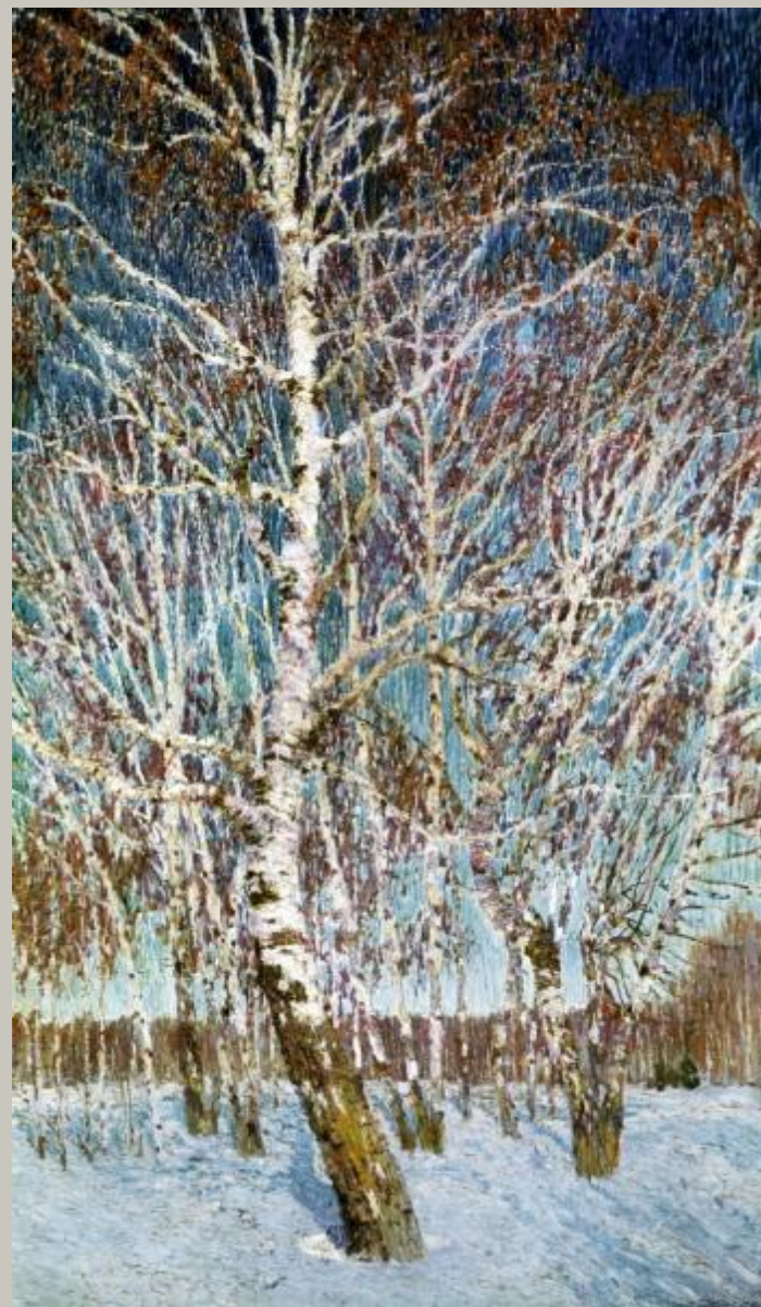
«Февральская лазурь» Грабарь И.Э.