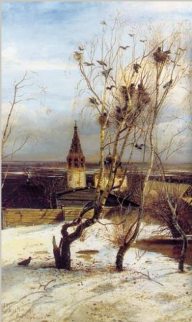
«100 рачи прилетели» Саврасов А.К.