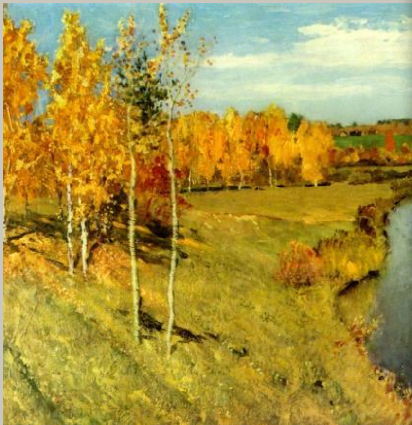
«Золотая осень» Левитан И.И.