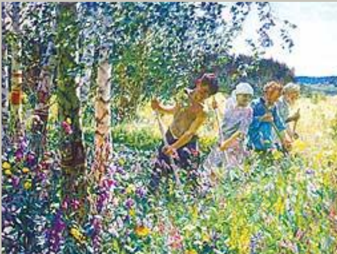
«Сенокос» Пластов А.А.