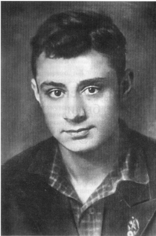
Эдуард Асадов 1923-2004

О, сколько мы к счастью путей искали 5 И все-таки главный секрет забыли 3 : Ведь если бы люди друг другу не лгали, Вы только представьте: нигде б не лгали 2!1 То как же бы все превосходно жили! 4