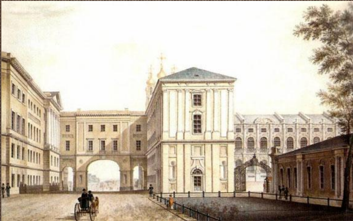
Императорский Царскосельский Лицей

Наверное, именно эту сказку и вспоминал юный Пушкин - лицеист, когда скучал по своим родным, по своей любимой няне Арине Родионовне, вспоминал её голос. В один из таких моментов и родился замысел будущей поэмы «Руслан и Людмила».