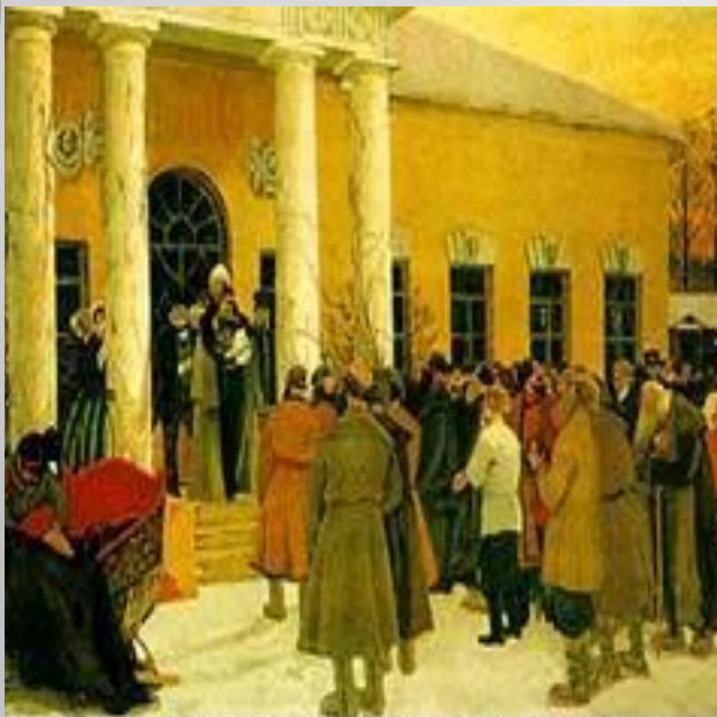
Б. Кустодиев "Освобождение крестьян"