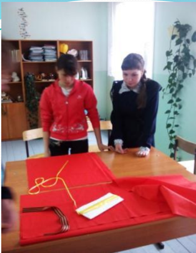
Участие в акции «Флаг Победы»