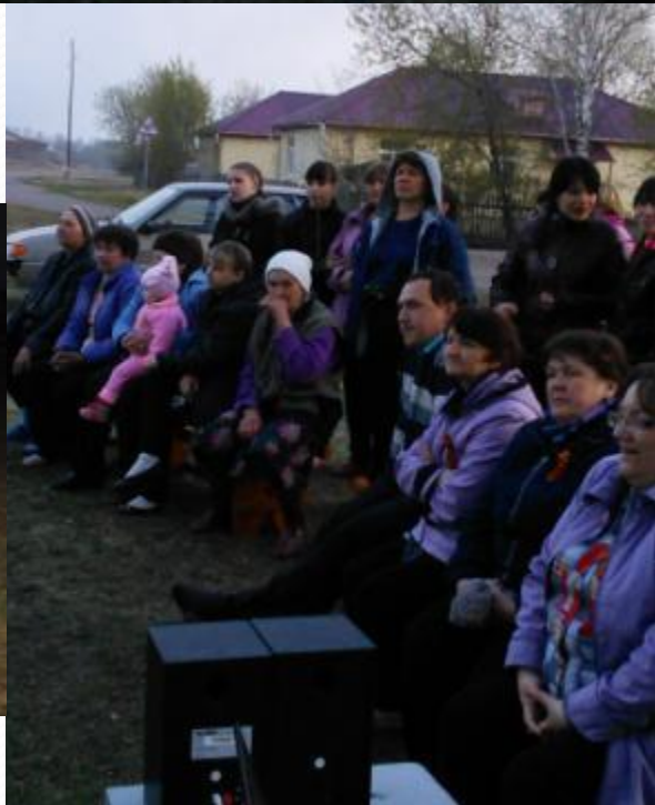
Вечер военной песни