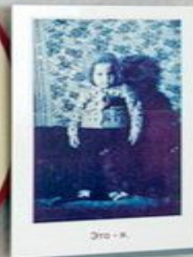
Это — я.

Любили тебя без особых причин За то, что ты — внук. За то, что ты — сын. За то, что малыш. За то, что растешь. За то, что на папу и маму похож.