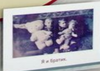
Я и братик.