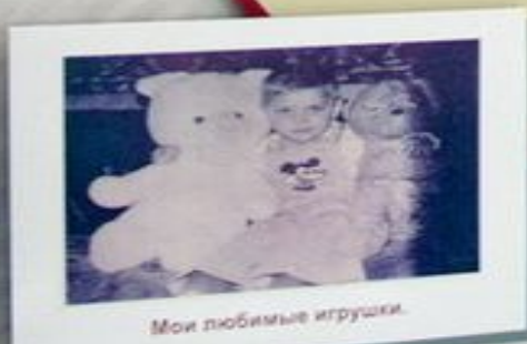
Мои любимые игрушки.