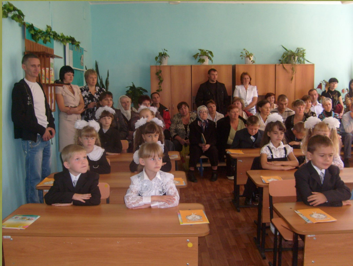
Родители – частые гости на уроках