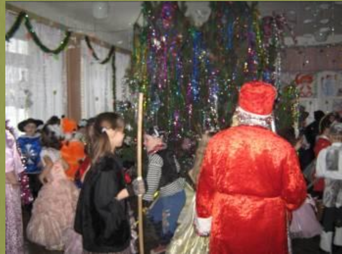
Родители -участники праздников.