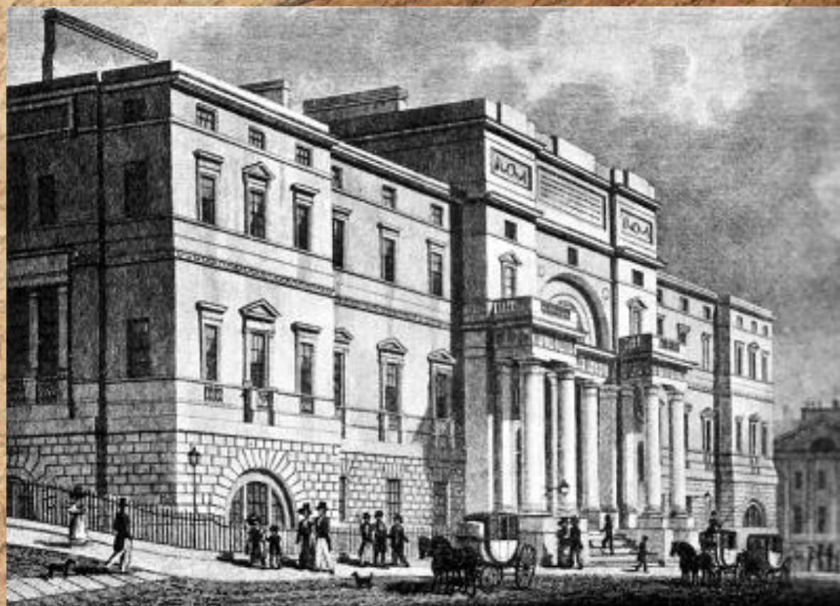
University of Edinburgh, 1827