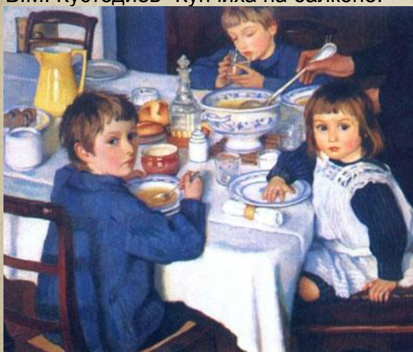
З.Серебрякова "За обедом."