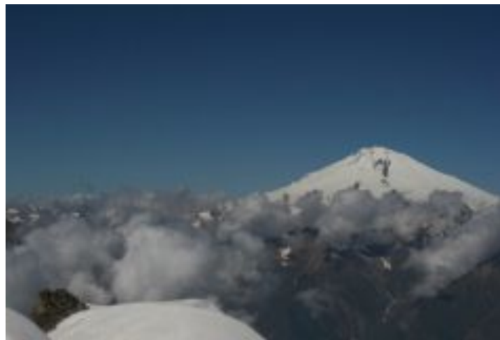
Гора Эльбрус (5642 м) — высочайшая вершина России (Кавказ)