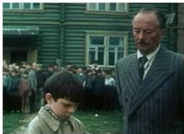
Кадр из фильма «Июль французского». Москва, 1976 г.