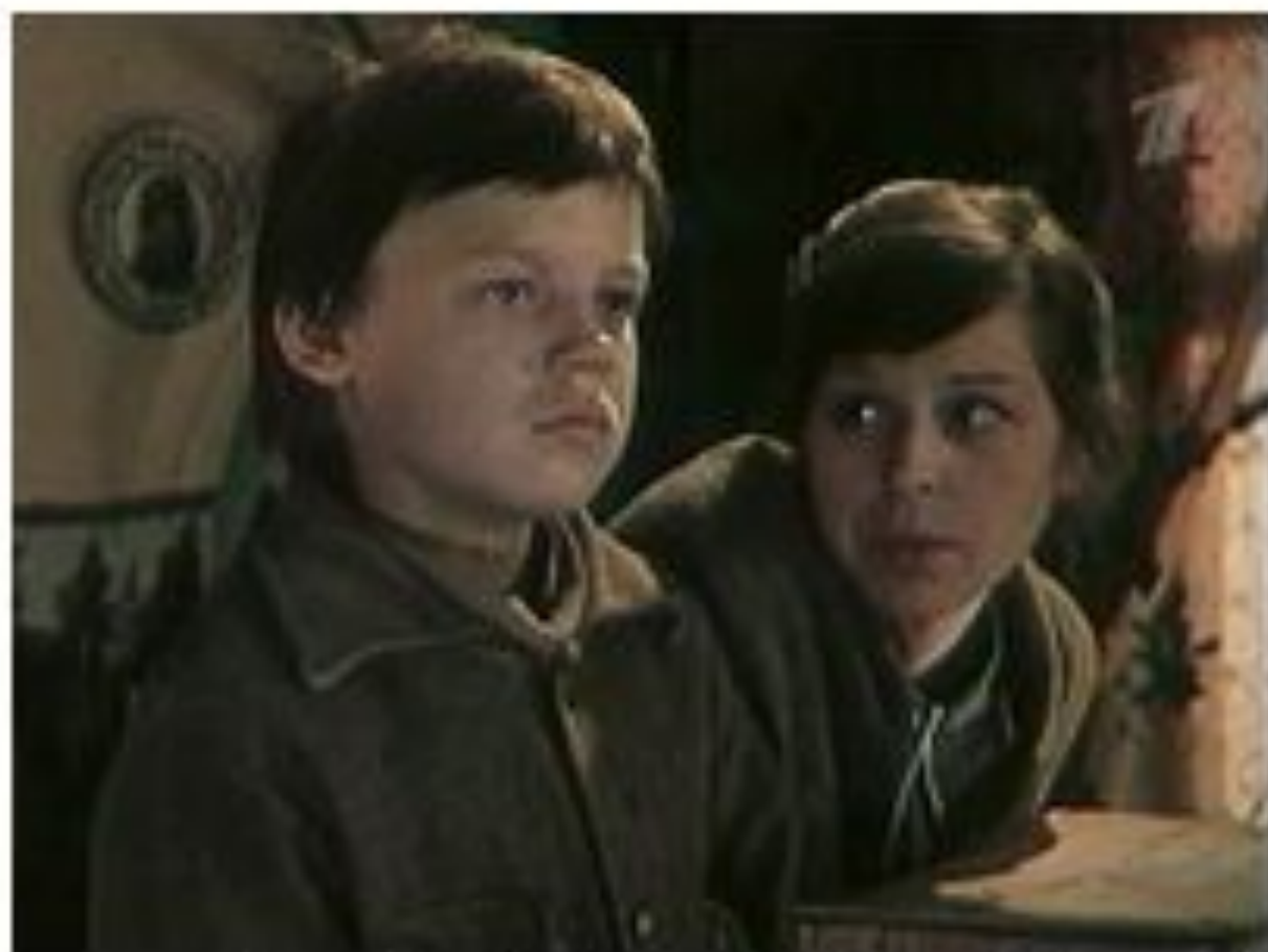
Кадр из фильма «Уроки французского». Москва, 1979 г.