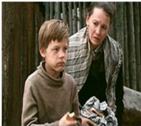
Кадр из фильма «Уроки французского». Мосфильм, 1979 г.