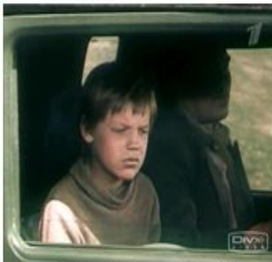
Кадр из фильма «Уроки французского». Мосфильм, 1979 г.