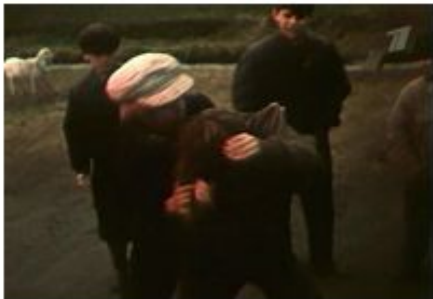
Кадр из фильма «Июль французского». Москва, 1976 г.