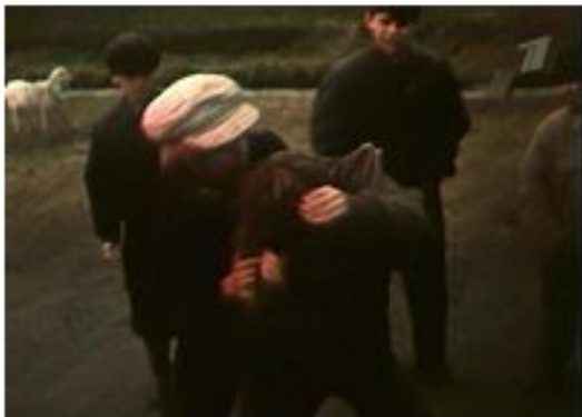
Кадр из фильма «Уроки французского». Мосфильм, 1979 г.