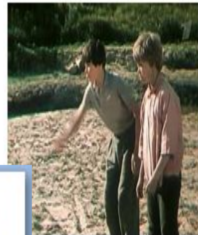
Кадр из фильма «Уроки французского». Мосфильм, 1979 г.