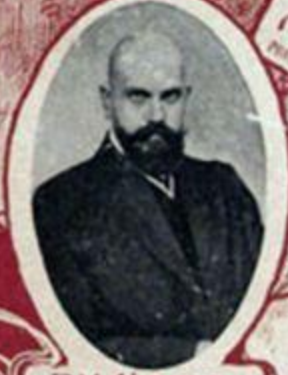
В. Н. ЛЬВОВЪ, оверъ-прокуроръ св. Синода.