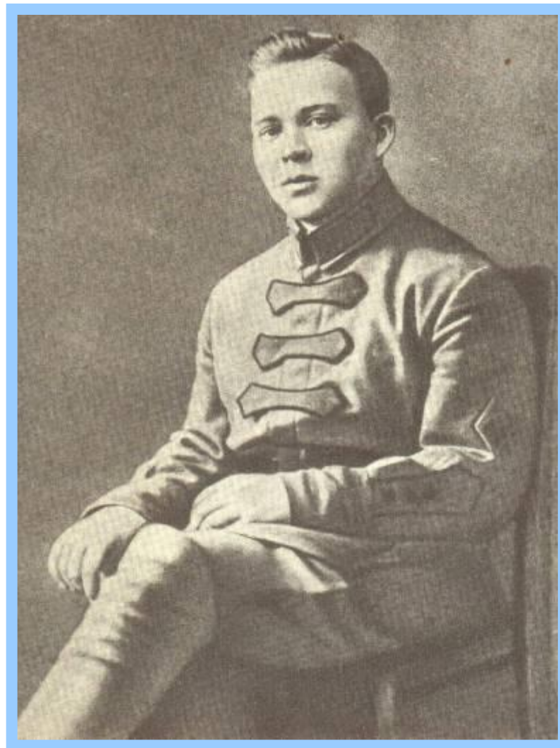
А. Гайдар – комбат ЧОН. 1922 год

Где бы ни служил Аркадий, он везде проявляет себя как инициативный, творчески мыслящий, одарённый человек