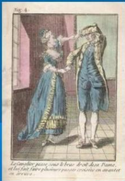
Аллеманда XVI век

Аллеманда — один из наиболее популярных инструментальных танцев эпохи Барокко, стандартная составляющая сюиты.