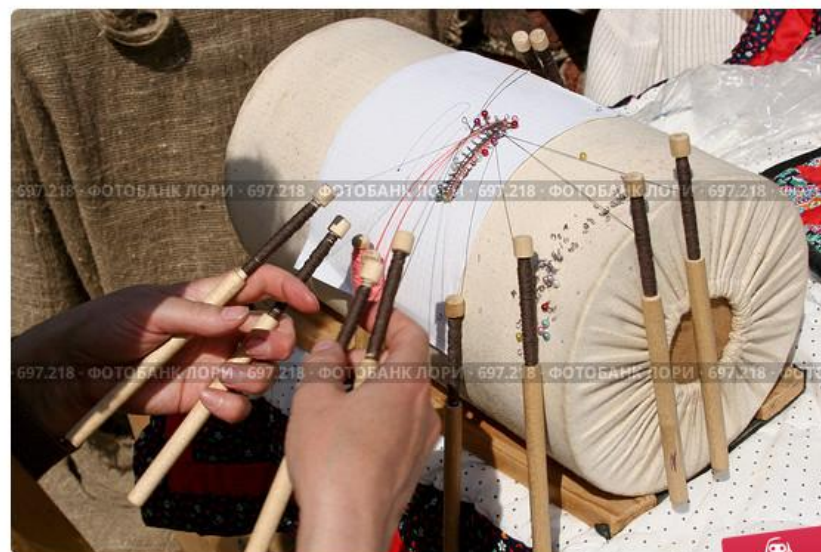
Плетение кружев на коклюшках