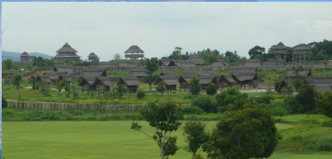
Реконструкция стоянка Ёсиногари

В них указывается, что древние японцы имели 100 малых стран, к 108 году до н. э. около 30 из них наладили контакт с китайцами, и иногда присылали дань Китаю.