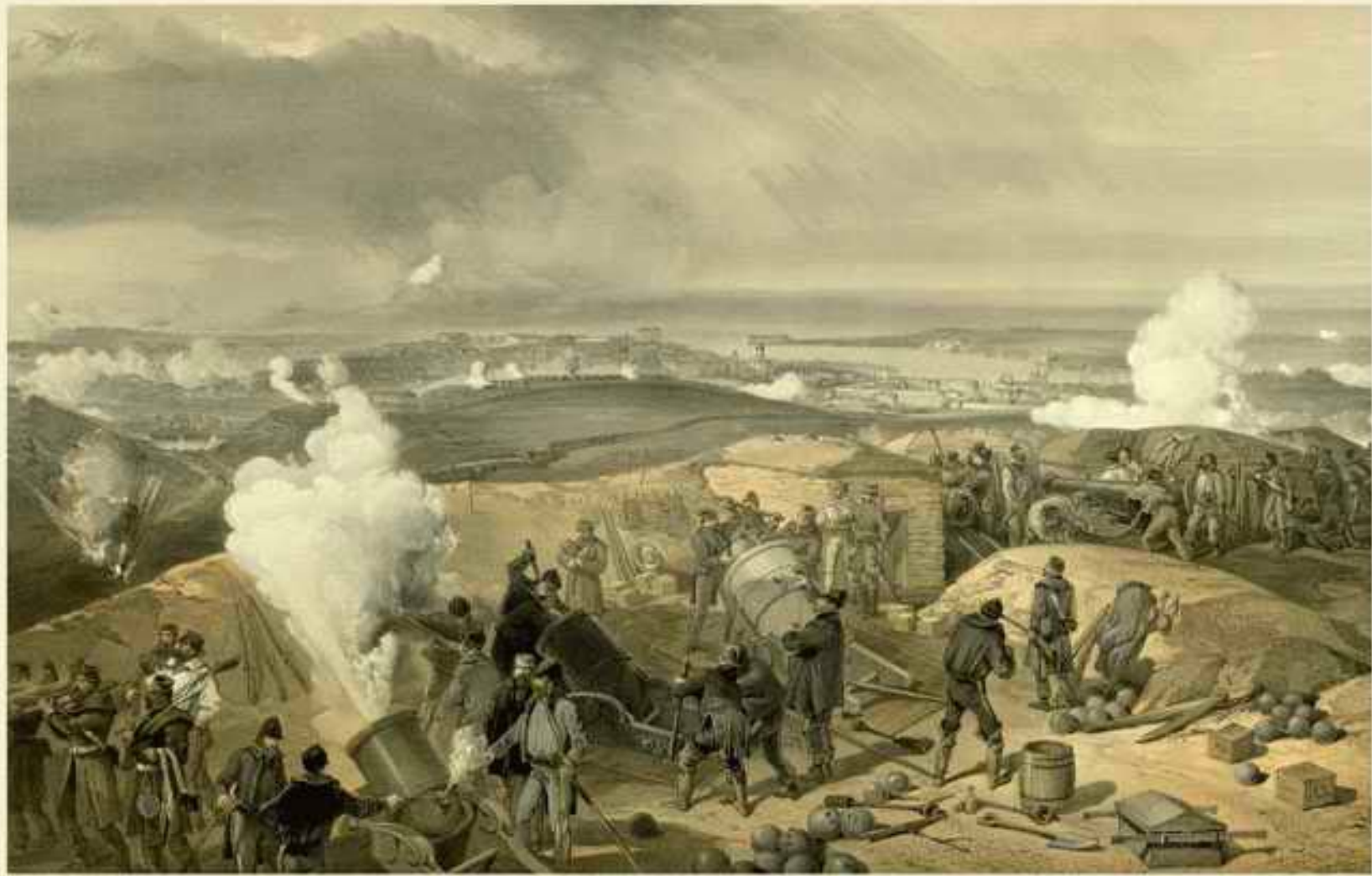
A Hot Day in the Batteries